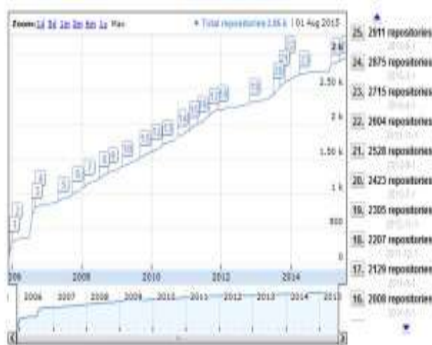
Figura 1-Curva de Crecimiento en Open Doar (15/04/2017)

Un repositorio de objetos de aprendizaje es un sistema de software creado principalmente para almacenar recursos educativos y sus metadatos (ó solamente estos últimos) y que proporciona algún tipo de interfaz de búsqueda de los mismos, ya sea para interactuar con los humanos o con otros sistemas de software (agentes o servicios web). Los repositorios proporcionan acceso a los OA generalmente en formato digital, aunque la mayoría no almacena los recursos educativos en sí, sino solamente sus metadatos. (Durán E. et al, 2013).