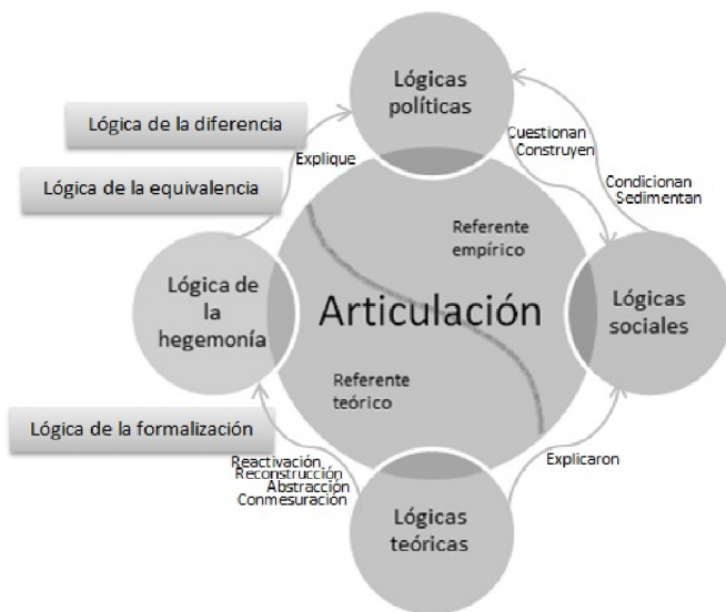
Cuadro N°1: elaboración propia

En primera instancia, podemos distinguir lógicas sociales , como sistemas de prácticas sedimentadas (que alguna vez tuvieron un carácter político) y lógicas políticas , como prácticas que cuestionan las lógicas sociales y que, quizás, en cierto momento las constituyan. La Teoría del Discurso se encarga de explicar las características de las lógicas políticas a través de la lógica de la hegemonía que, como señalamos con anterioridad, analiza el proceso mediante el cual una demanda particular se proyecta en una identidad universalizante. A su vez, la hegemonía trabaja a través de lógicas como la equivalencia y la diferencia que relacionan los elementos del discurso, (re)estructurando el espacio social.