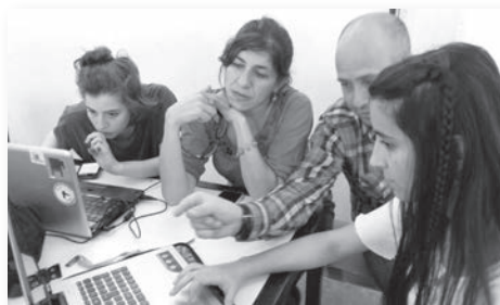
Figura 3 Seguimiento docente en el proceso de diagramación y de preparación de originales

Todas las propuestas fueron analizadas y evaluadas por los docentes y por representantes de Abuelas de la Paz. Los estudiantes también participaron con su voto y fue su voz la que definió la selección de dos trabajos que, amalgamados, constituían un producto viable [Figura 3].