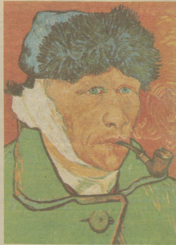
Van Gogh, kesik kulaklı halini gösteren portre çalışması. (Paul Rosenberg Koleksiyonu, Paris)

1853 yılında Hollanda'da doğan Van Gogh bir Protestan papazının oğluydu. İlk önceleri İngiltere ve Belçika'da maden işçileri arasında din adamlığı yapan