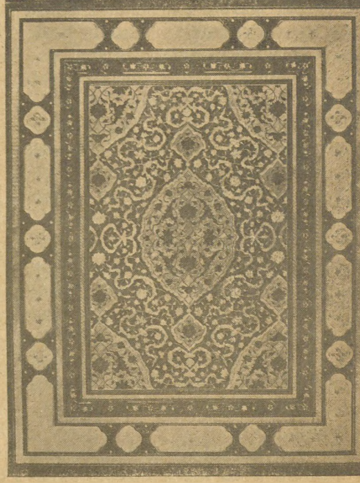
Bir Türk Sanatı : Tezhip

— Bu öyle bir yazı ki herkes bilir fakat hiç kimse bilemez.