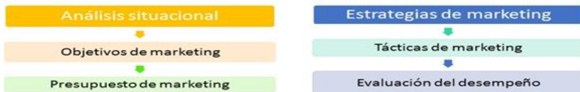
Figura 1.2 Clow, et. al, 2010, pág. 9