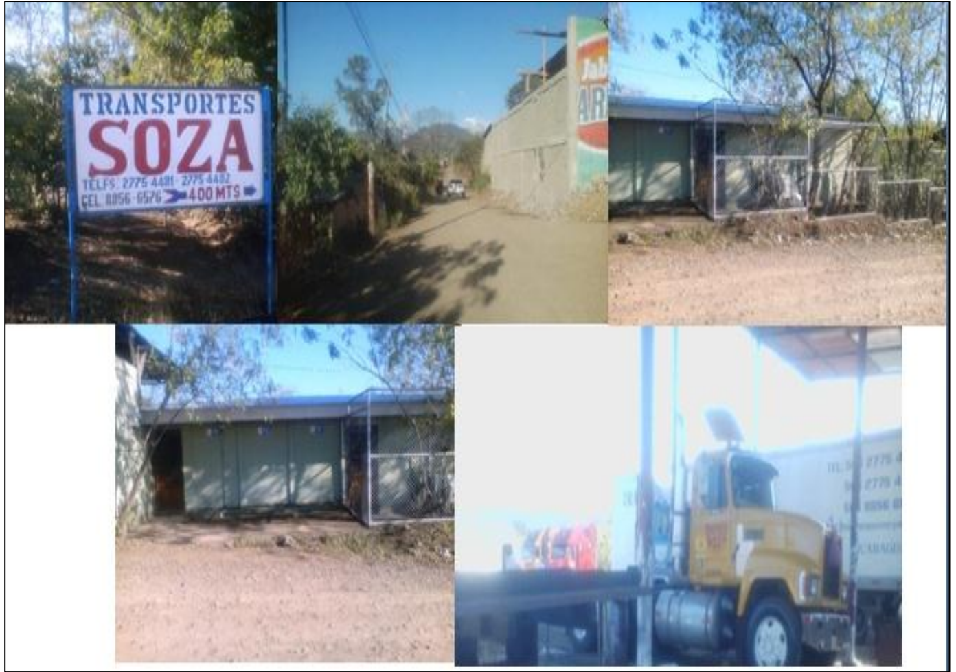
Instalaciones de la empresa Transportes Soza.