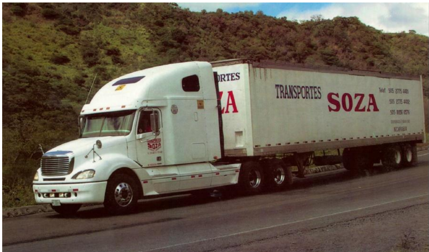
Equipo de carga