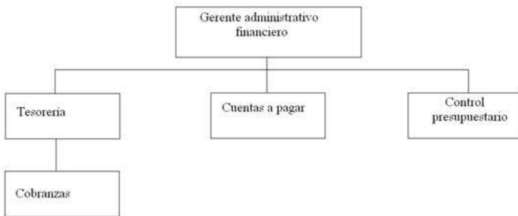
Cuadro N° 1.