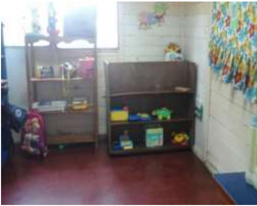
Rincón de juegos