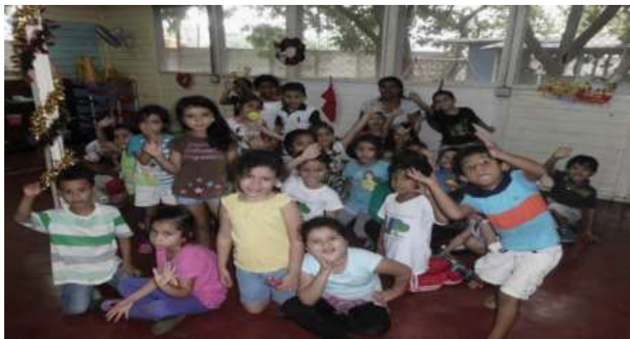
Actividades con los niños y niñas

Niños y niñas del tercer nivel de preescolar