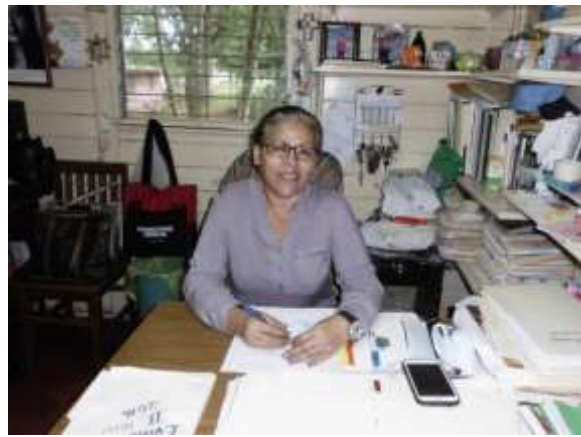
Directora del centro escolar Arlen Siu