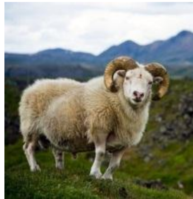
Carnero (macho de la oveja)