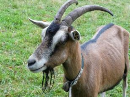
Macho de la cabra