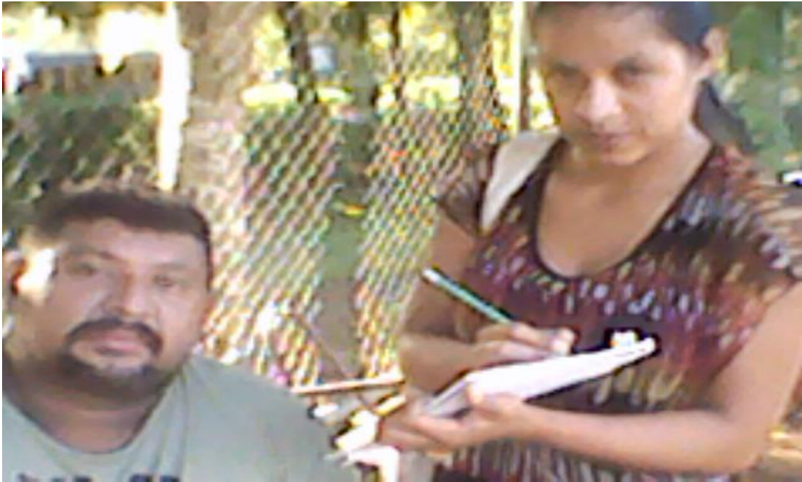
Entrevista a padres de familia.