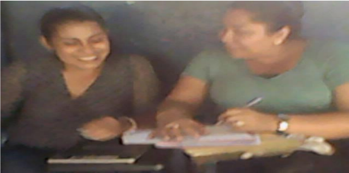
Entrevista a la docente.