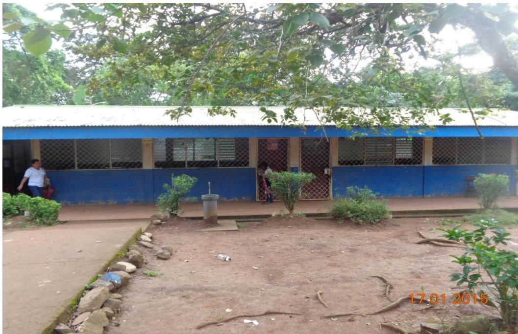
Escuela Rafaela Herrera

En la actualidad la escuela Rafaela Herrera en NEU (núcleo educativo urbano) que tiene 4 escuelas satélites de educación primaria.