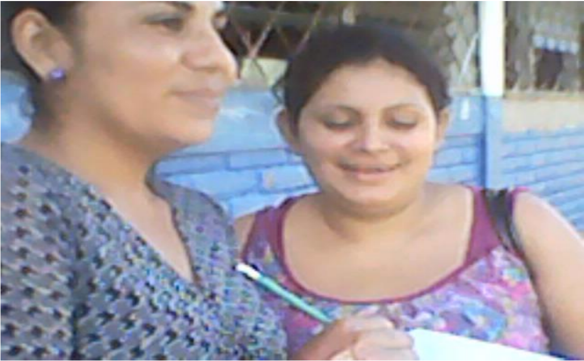
Entrevista a madre de familia.