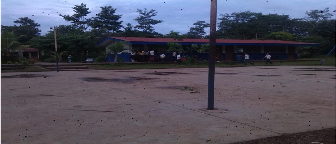
Escuela Miguel Larreynaga Las Azucenas