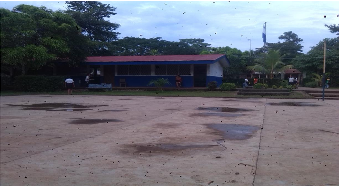
Dirección de la escuela Míguela Larreynaga