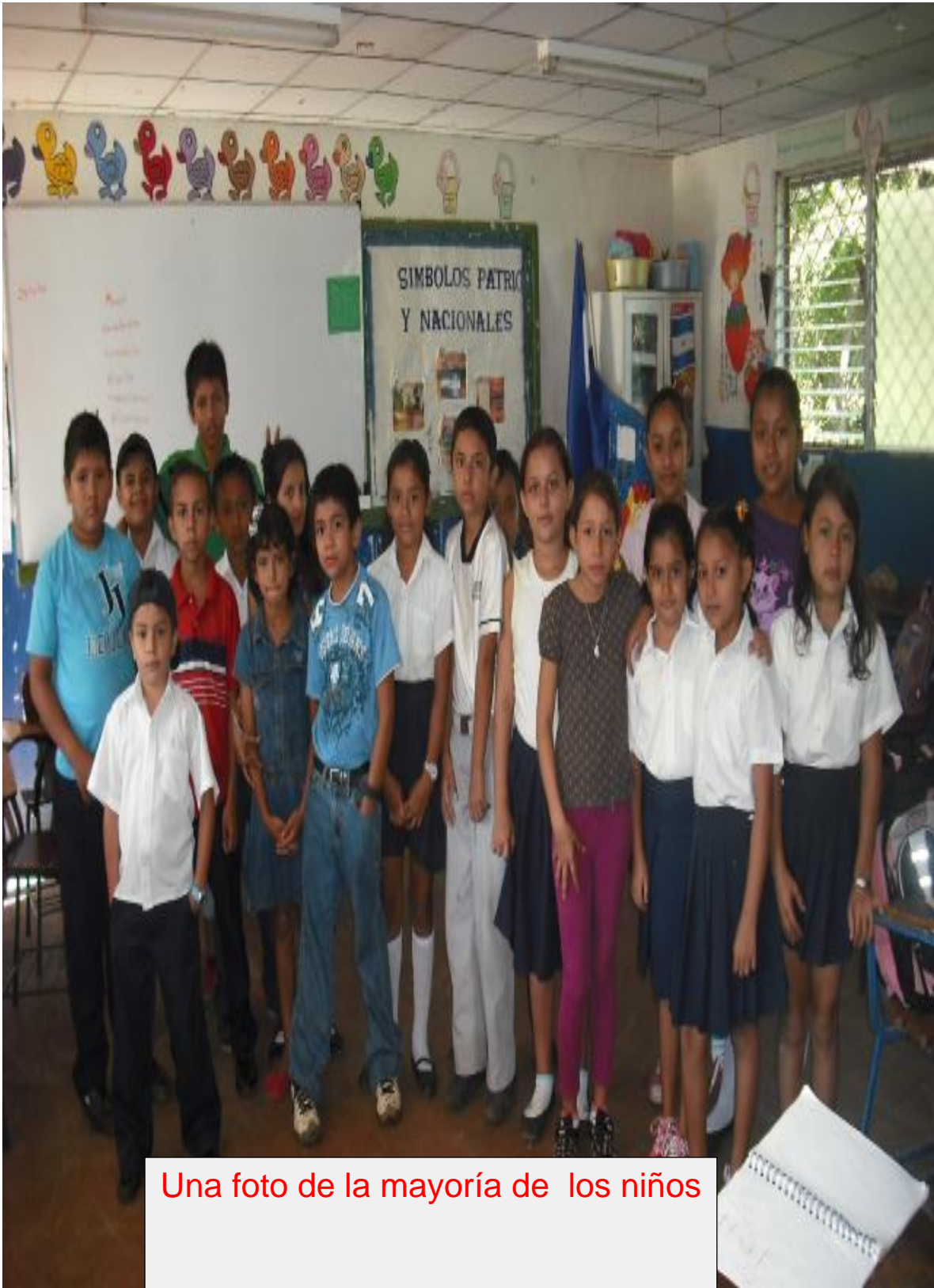
Una foto de la mayoría de los niños