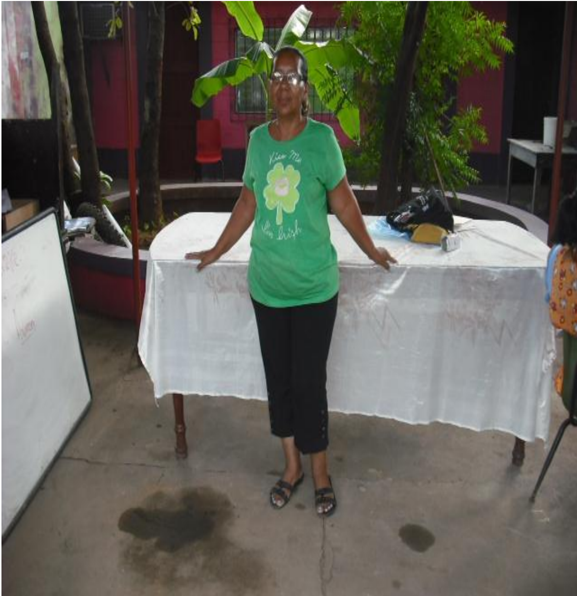
Directora del centro educativo Rodolfo Schear