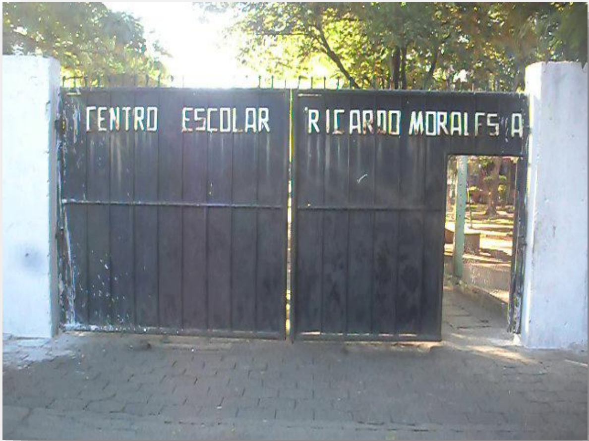
Entrada al centro de investigación portón principal