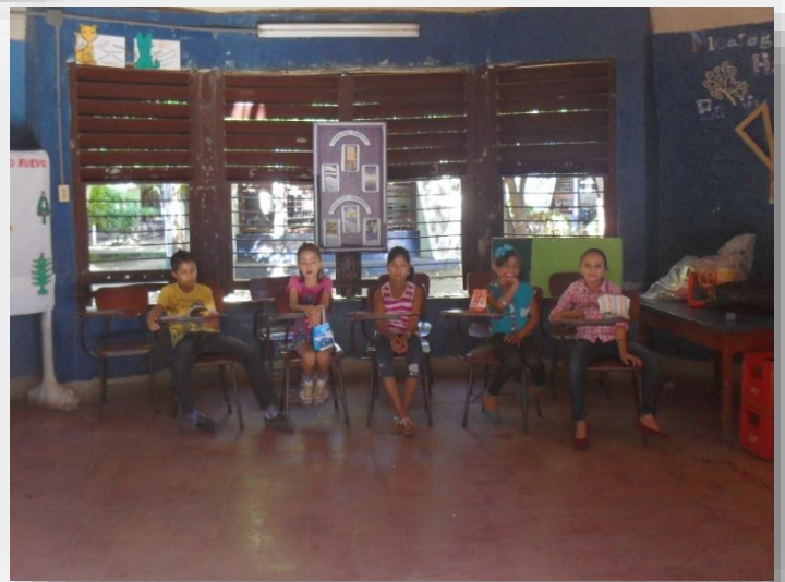
Familia educativa de la investigación