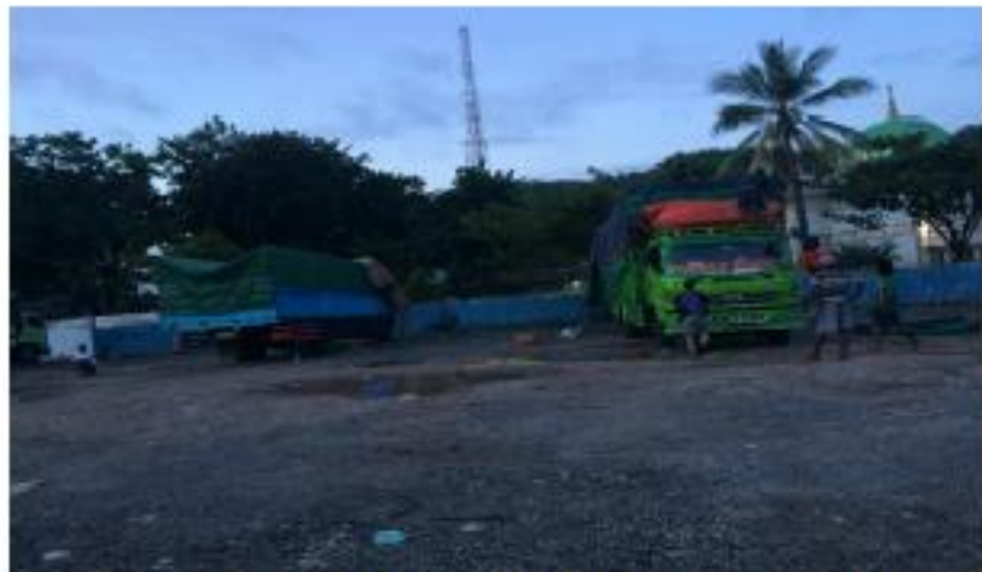
Gambar 2. Kendaraan Besar (HV) yang Parkir Pada Pagi Hari