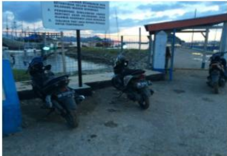
Gambar 1. Sepeda Motor (MC) yang Parkir Pada Pagi Hari