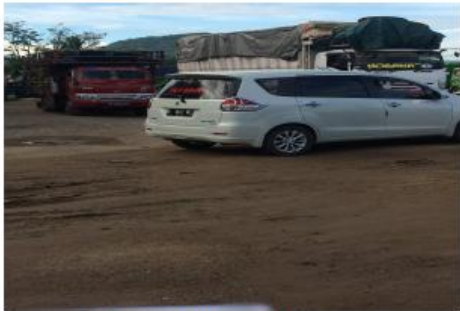
Gambar 3. Kendaraan yang Parkir Pada Sore Hari