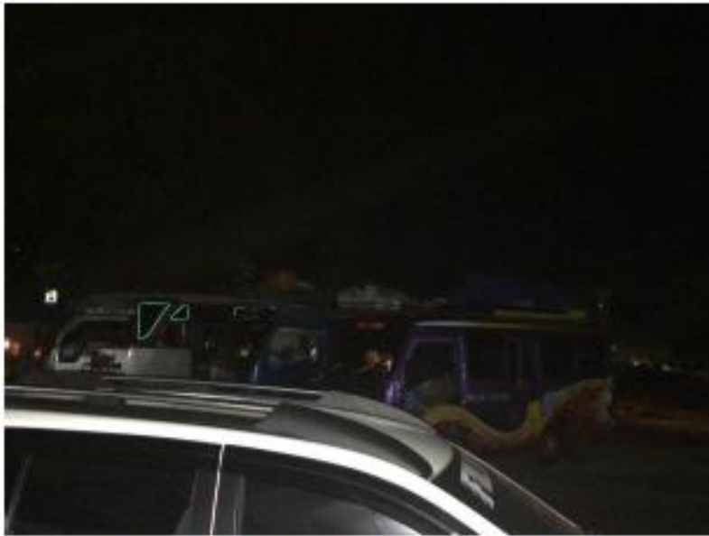
Gambar 5. Kendaraan yang Parkir Pada Malam Hari