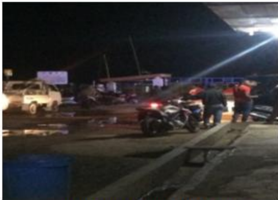
Gambar 4. Kendaraan yang Parkir Pada Malam Hari