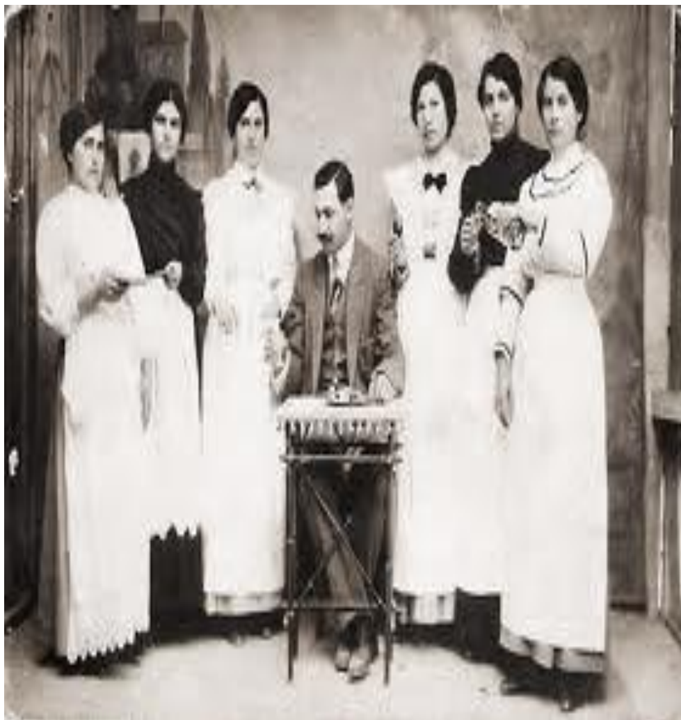
“El grupo de servicio doméstico con el señorito”. La servidumbre en el siglo XIX .

La importancia y la satisfacción que supone para la servidumbre servir a un varón es uno de los rasgos más significativos del orden estamental. Procurar el bienestar de las figuras masculinas implica, para el imaginario de las sirvientas, servir a las personas más relevantes de la escena familiar, a las que hacen un verdadero ejercicio de autoridad, a las económicamente privilegiadas, con valores morales y con reconocimiento social; ello supone, desde su perspectiva, orgullo, cierto ascenso social y una mejor posición con respecto a las otras mujeres de la servidumbre.