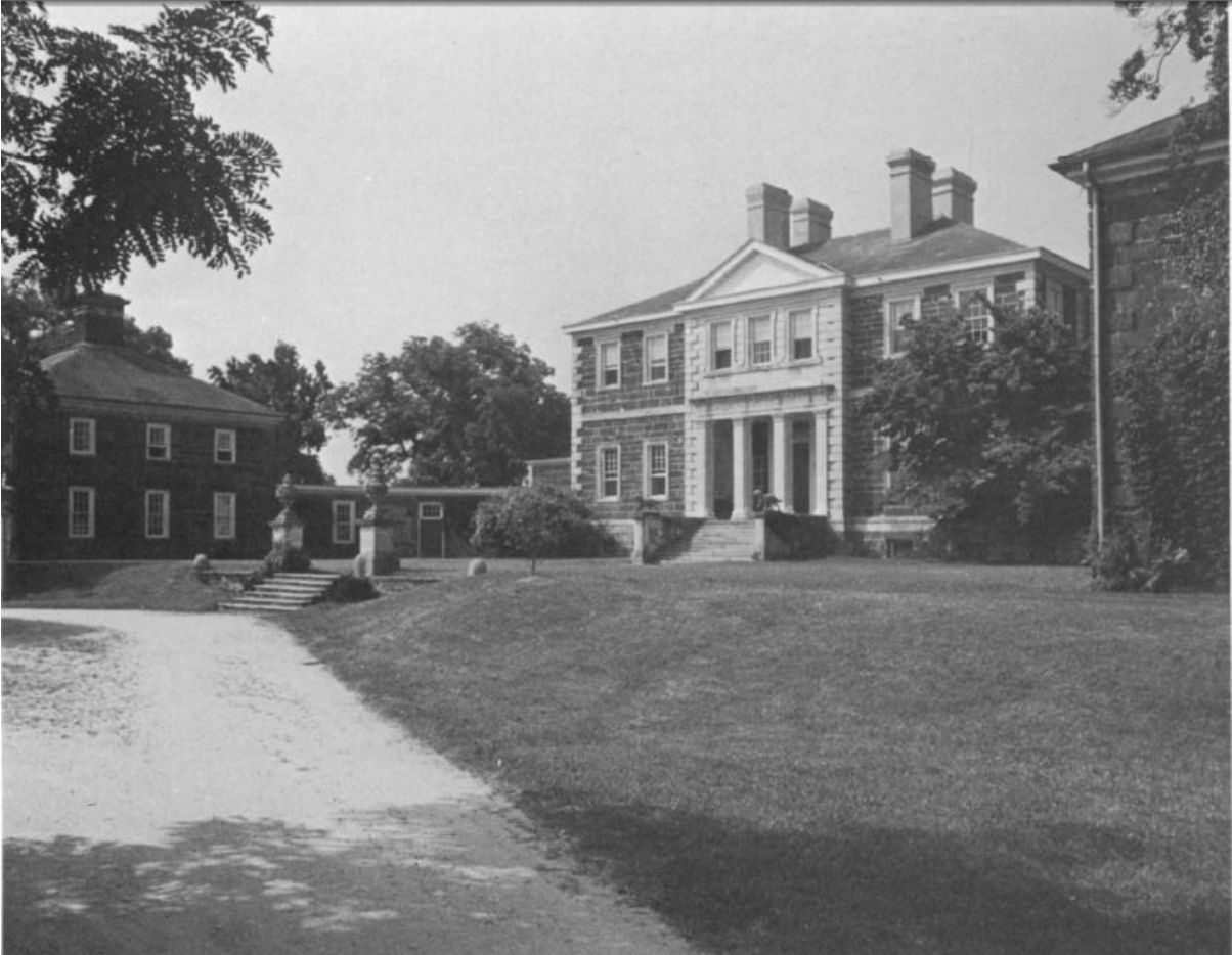
Fachada norte (entrada). Mount Airy, Richmond, County, Virginia. (1758). Fotografía por Richard Cheek. Tomado de George B. Tatum. "Architecture". American Art Journal.

La fachada, sin lugar a dudas, constituye una de las representaciones más importantes de la morada burguesa; su preponderancia radica en que es una de las formas más reveladoras del estatus y riqueza que posee el varón-jefe de familia; no importa en qué condiciones se encuentren los espacios interiores de la casa o quiénes los ocupen, pues de inicio lo primero que se revela es la importancia social y el papel del dueño de la casa .