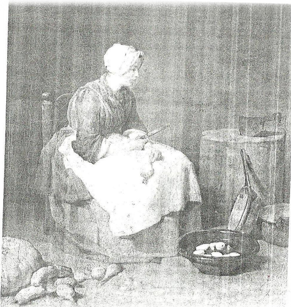
Tomado de Cissie Fairchild. Domestic Enemies. Servants and their masters in old Regime France (1984).

Uno de los elementos centrales en la comprensión de la subjetividad es el cuerpo; a través de sus movimientos, desplazamientos, actitudes, gestos y posturas es posible advertir las señales de la marginación, el desprecio y la subordinación. El cansancio, el hartazgo que puede producir la rutina de labores domésticas, los sentimientos que produce encontrarse en cierto espacio, el trabajo que deteriora, todo ello se halla inscrito y se expresa a través del cuerpo.