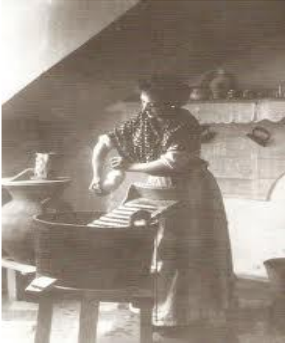
“La Rochapea del siglo del siglo XIX. Un barrio de mujeres trabajadoras”. En El rincón de la Historia de la Rochapea (2010).

Sótanos, buhardillas o cuartos de servicio son los espacios con los que se asocia a las sirvientas; allí no importan las incomodidades con las que las sirvientas tengan que trabajar o vivir; espacios soterrados, en penumbras, asfixiantes, deprimentes; son los espacios de la servidumbre.