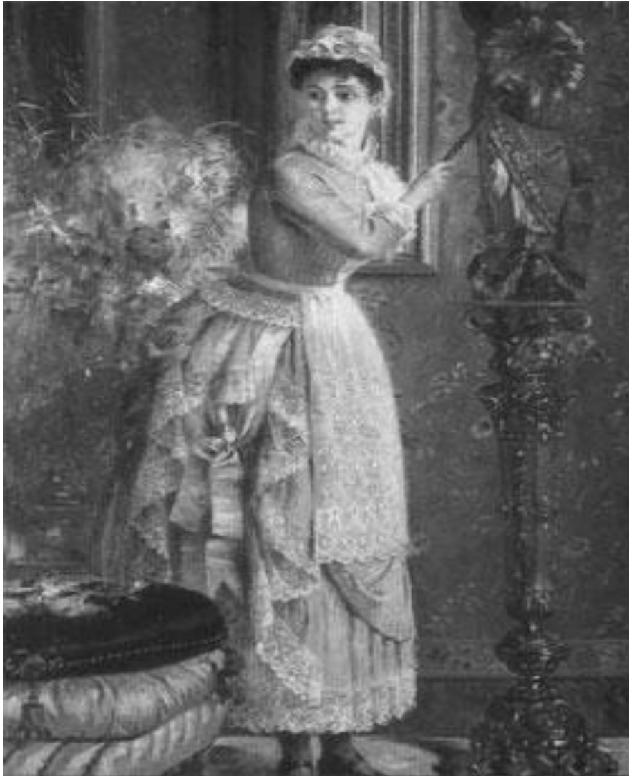
“Fantasías Domésticas”. Siglo XIX. Tomado de Lilia Granillo Vázquez. El valor de las amas de casa, del gasto familiar a pucheros, escobas y poesías.

Las escenas domésticas con insistencia representan una visión optimista del rol de las criadas o de las amas de casa, a quienes generalmente se presenta realizando los quehaceres del hogar muy felizmente. Los espacios con los que imaginariamente son asociadas las mujeres no son menos relevantes que los objetos y las actividades con las que también son identificadas aquellas.