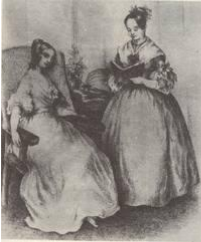
“Después de las faenas domésticas”. Siglo XIX. Tomado de Lilia Granillo Vázquez. El valor de las amas de casa, del gasto familiar a pucheros, escobas y poesías

La pasividad, los ademanes, los gestos, ciertas posturas corporales y hasta el arreglo personal han resultado elementos decisivos en la construcción subjetiva de las mujeres a la que han contribuido, en buena medida, las expresiones estéticas.