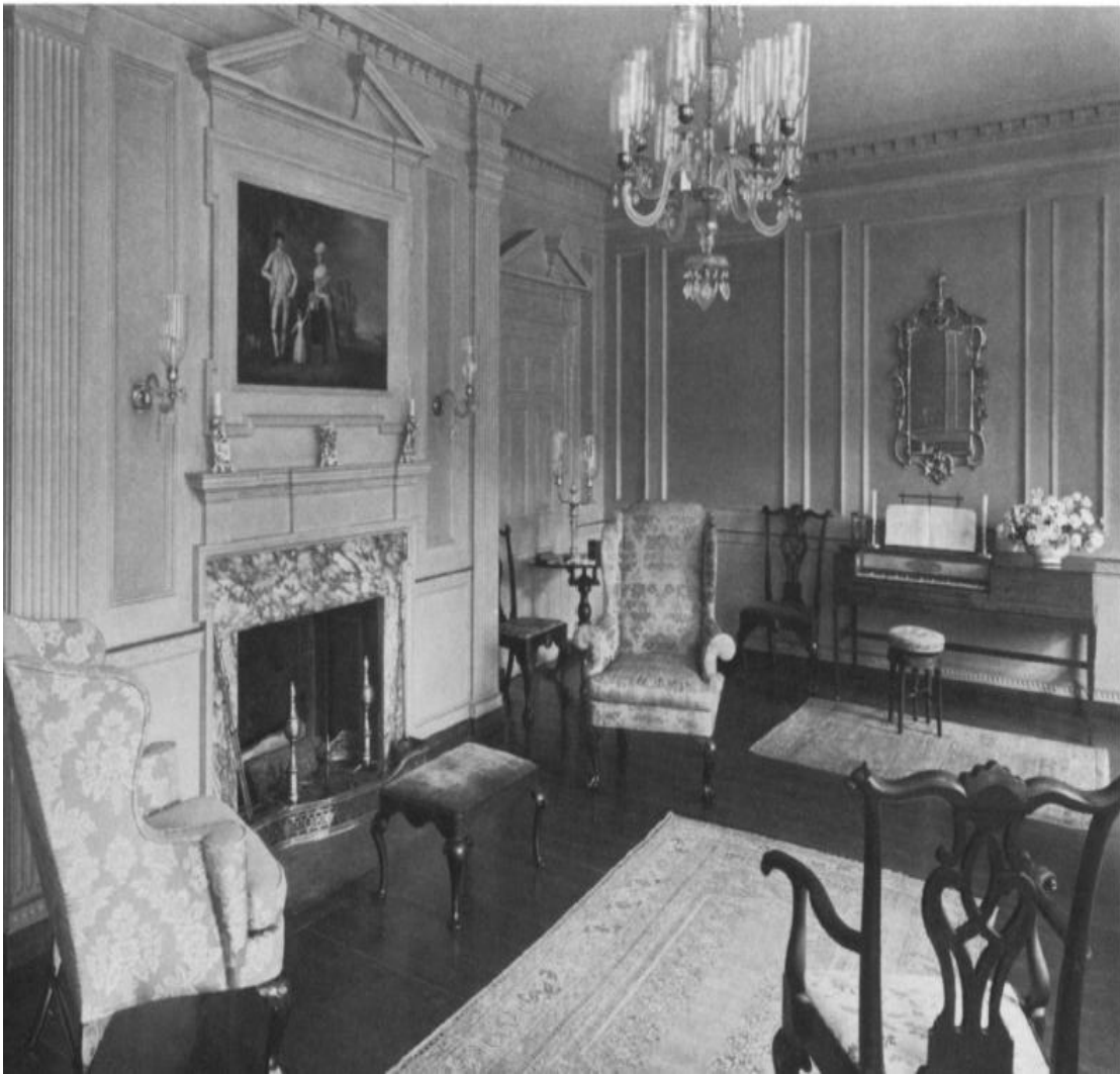
El gran aposento. Casa Corbit-Sharp. Odessa, Delaware. (1772). Foto cortesía del Museo Henry Francis du Pont Winterthur. Tomado de George B. Tatum. "Architecture". American Art Journal.

El salón en la casa moderna occidental se muestra como un lugar de primera importancia, la familia se ofrece aquí como un espectáculo a sus invitados: expone los objetos que afirman su estatus social, el tipo de fortuna que posee, sus valores y gustos. Puede ser el lugar donde se planean los negocios entre iguales, se disfruta de la compañía de los invitados y se refuerzan los papeles de cada uno de los integrantes de la familia burguesa.