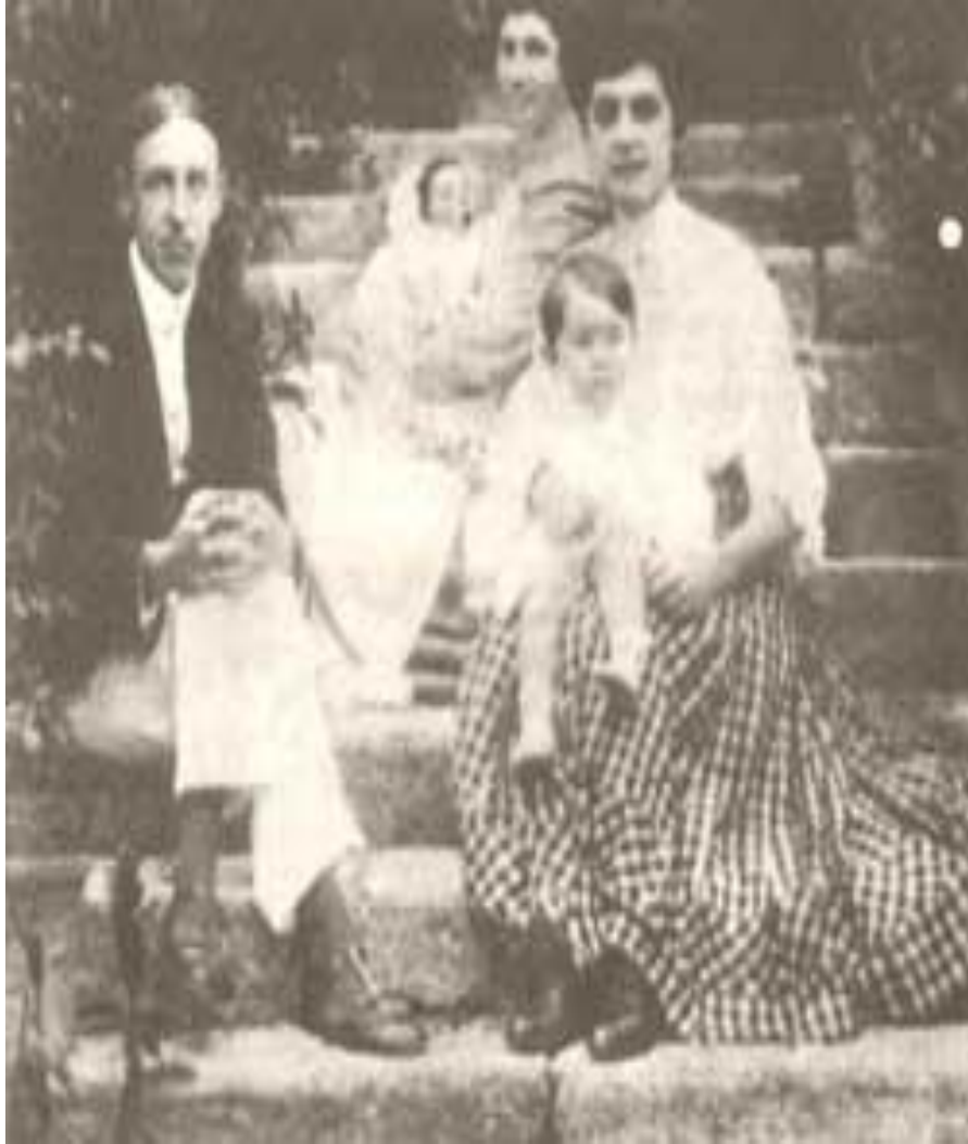
“Mujer y educación en el siglo XIX”.

El ideal de vida matrimonial y de la maternidad proliferan y se difunden a través de diversas imágenes: mujeres orgullosas de sus roles y de la llegada de sus hijos forjan claramente las concepciones sociales dominantes sobre la feminidad y la relevancia de la vida familiar. Obsérvese que quienes muestran con orgullo a los hijos son las mujeres y sus acciones y actitudes constituyen rituales fundamentales en la construcción y reproducción identitaria de su figura en las sociedades modernas.