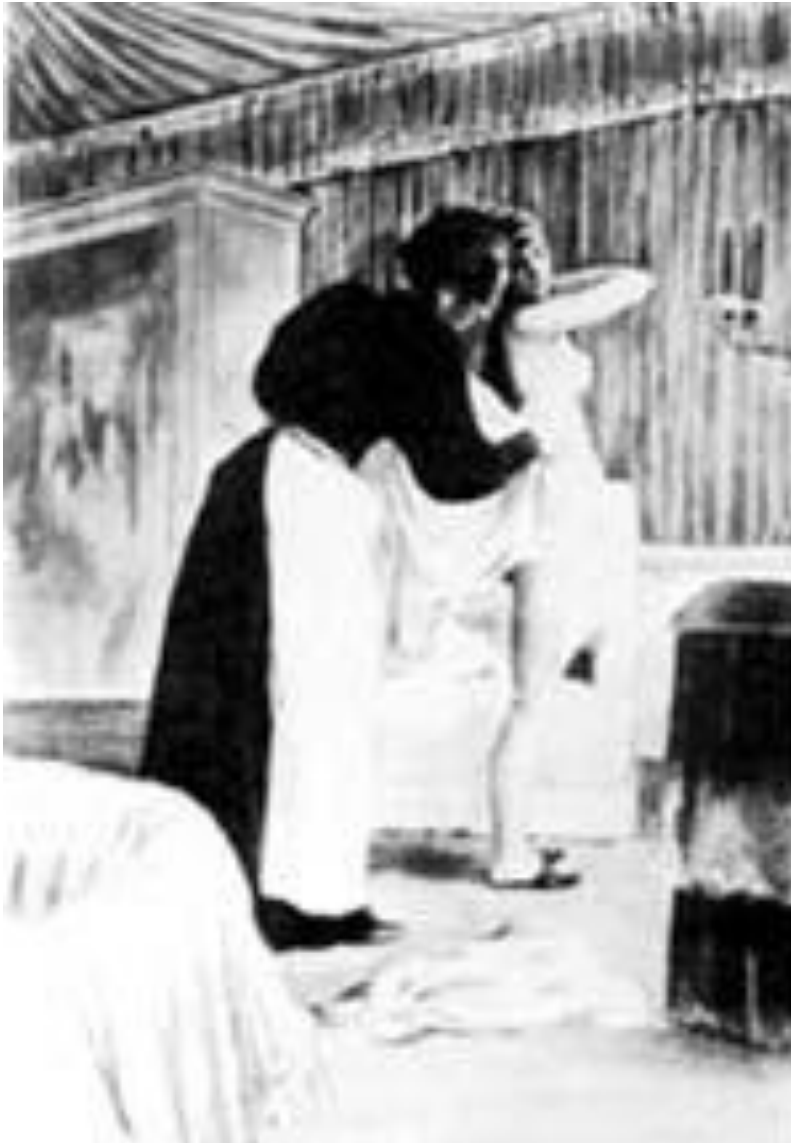
“La mujer en París”. Octave Uzanne, París. Biblioteca Histórica. Tomado de Perrot, Michel. “Los actores”. En Historia de la vida privada. La revolución francesa y el asentamiento de la sociedad burguesa (1991).

La negación y la permanente invisibilidad de la persona de los sirvientes, la desaparición de su cuerpo, de sus opiniones o pensamientos se manifiesta notoriamente en la inexistencia del sentimiento de pudor que pudiera producir una situación como la ducha. Es como si las criadas no estuvieran y lo que pudieran opinar o pensar ante cierto tipo de situaciones resulta totalmente irrelevante a los ojos de los integrantes de la familia.