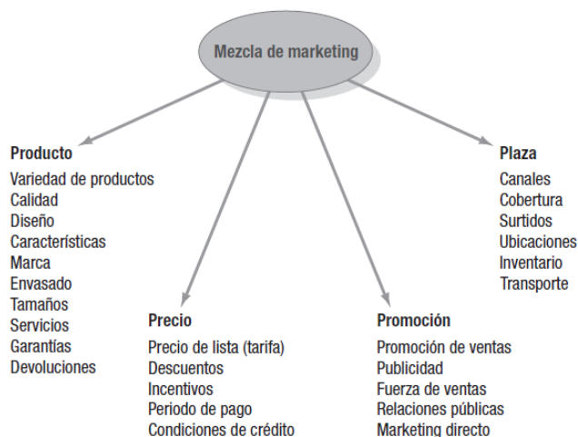
Imagen 2. Mezcla de marketing