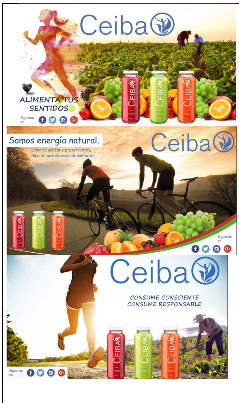
Imagen 3. Piezas publicitarias.