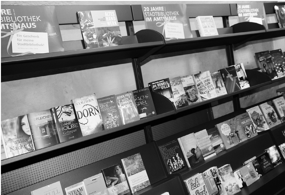
Abb. 3: Das Präsentationsregal in der Buchhandlung © Stadtbibliothek Schwäbisch Gmünd.