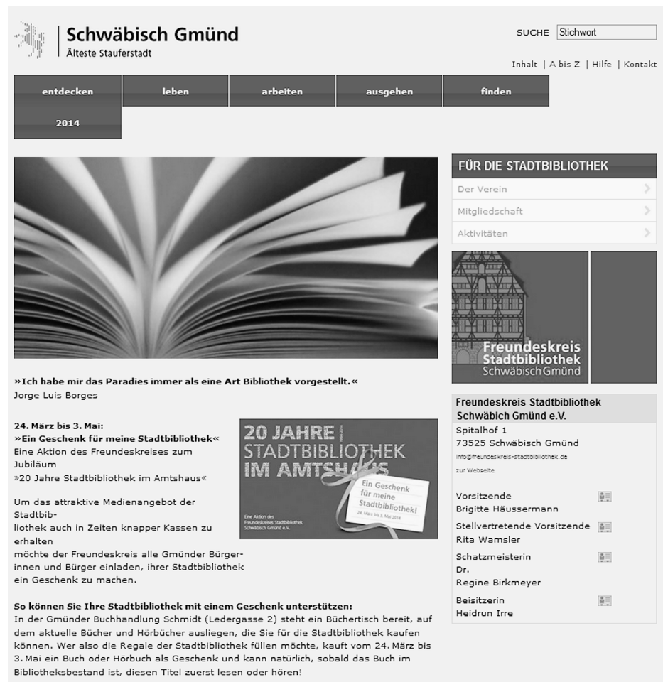
Abb. 2: Professionell gestaltet: Webseite für die Aktion „Ein Geschenk für meine Stadtbibliothek“ © Stadtbibliothek Schwäbisch Gmünd. 8