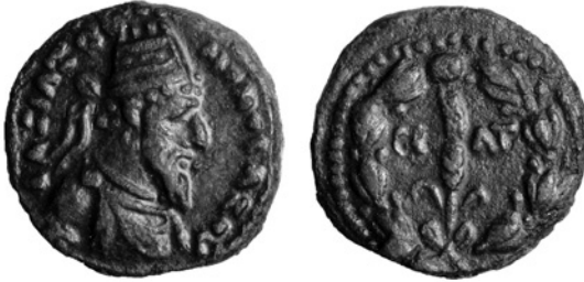
Abb. 2 Münze des Monobazos (I.) aus dem Jahr 20/21 n. Chr.

me supplices confugerunt reges Parthorum Tiridates et postea Phratis regis Phratis filius, Medorum Artavasdes, Adiabenorum Artaxares ... 19 Der genaue Zeitpunkt ist leider unbekannt; da allerdings der in dieser Passage erwähnte parthische Prätendent Tiridates mehrfach während der 30er und 20er Jahre des 1. Jahrhunderts v. Chr. auf römisches Gebiet geflohen war 20 und in derselben Zeit auch die Flucht der Mederkönige Artavasdes (um das Jahr 30) und Ariobarzanes zu den Römern bezeugt ist, 21 könnte auch die des Adiabenerkönigs in diese Zeit fallen: 22 Als historischer Kontext wäre eine Verwicklung der Adiabener in die innerparthischen Auseinandersetzungen dieser Zeit naheliegend. Alternativ könnte man an die politischen Spannungen um Armenien (in den 20er Jahren v. Chr. oder 3 v. Chr.) denken, 23 zumal die Adiabene in der Nachbarschaft Armeniens lag.