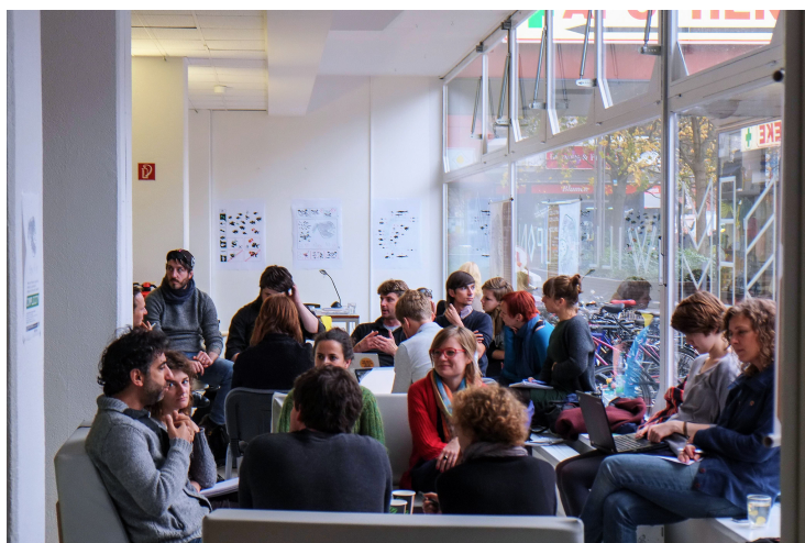
Abbildung 3: Konferenzteilnehmer

unsere Werke digital frei zur Verfügung stellen – aber wir wollen auch von unserer Arbeit leben können!