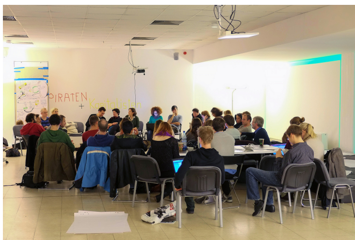
Abbildung 4: Workshop Piraten und Kapitalisten

Die Großgruppe der Piraten reagiert ein wenig irritiert auf unsere Präsentation, da wir uns nicht auf die Island-Utopie eingelassen hätten. Vielleicht, um uns wieder ins Boot zu holen, interpretiert dann jemand unsere reale Bibliothek als „universal classroom“ – und führt sie so in die utopische Sphäre zurück.