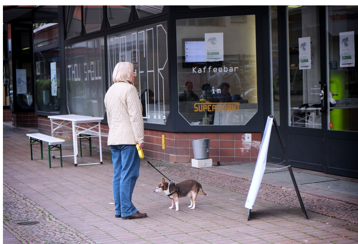
Abbildung 2: Supermarkt

Warum heißen wir eigentlich „Piraten und Kapitalisten“, und wer ist wer? In der Vorstellungsrunde wird deutlich: Fassen wir unter „Piraten“ die Aktivisten, die für eine freie Grundstruktur des Internet und für Informationsfreiheit eintreten, dann sind wir fast alle Piraten. Allerdings distanzieren sich einige Teilnehmer entschieden von Formen „piratischen“ Handelns wie dem illegalen Filesharing in Datenbanken - etwa der Musiker, der es ablehnt, „to rip off someone else's stuff“. „Kapitalisten“, da ist sich die Gruppe einig, sind die Global Players wie Google und Amazon, die durch ihre kommerziellen Interessen die Freiheit im Internet gefährden. Vielleicht nicht überraschend, will sich unter uns kein Kapitalist finden.