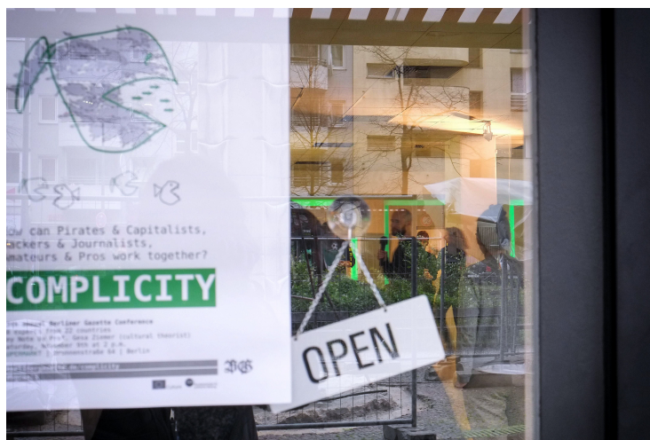
Abbildung 1: Konferenzposter

frisch sind. Der Horizont ist also weit gespannt, die Hintergründe sind vielfältig. Man spricht Englisch. Alle Anwesenden sind aktiv, ein passives Publikum ist nicht vorgesehen.