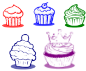
Gambar 3. Lima Jenis Cupcakes dalam Board Game

Tema yang ingin dikembangkan dalam board game adalah tentang perusahaan pembuat cupcake . Tema ini dipilih karena kue sangat mudah dipahami proses bisnisnya dan lebih familiar bagi para mahasiswa (jenis cupcake lihat gambar 3).