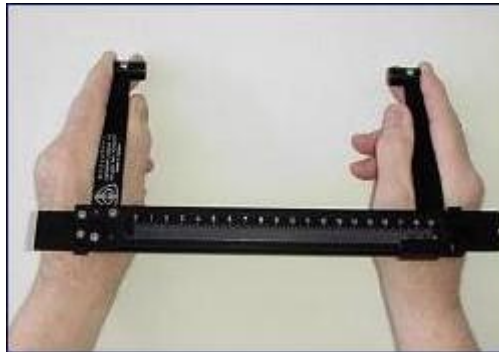
Gambar 2 Rosscraft Campbell 10 Small Bone Caliper

Alat ini disebut sebagai small bone caliper , 18 cm, yang memiliki prinsip sliding branch dan memiliki plat tekanan dengan diameter 10 mm untuk menyediakan area bagi epicondyles (lihat Gambar 2). Alat ini biasanya digunakan untuk mengukur lebar telapak tangan dan kaki, dan beberapa dimensi tubuh yang relatif kecil.