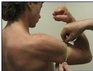
Gambar 5 Anthropometric Tape/Meter Tape

Alat ini sering disebut sebagai pita baja fleksibel dengan lekukan dan patch zero indicator yang mampu menyediakan interface yang lebih baik (lihat Gambar 5). Sebagai alternatif pengganti, kita juga bisa menggunakan meter-tape yang sederhana. Meter-tape memiliki sifat yang universal dalam artian alat ini bisa dipakai untuk mengukur keseluruhan 36 dimensi tubuh. Walaupun demikian, yang perlu mendapat perhatian penuh adalah cara pengukuran yang benar dan sesuai prosedur.