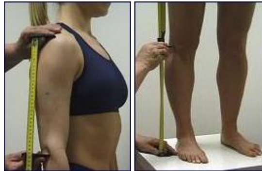
Gambar 3 Segmometer

Alat ini berguna untuk mengukur ketinggian proyeksi ( projected heights ) dan panjang segmental langsung ( direct segmental lengths ) seperti tinggi tubuh, tinggi bahu dalam posisi berdiri dan sebagainya (lihat Gambar 3).