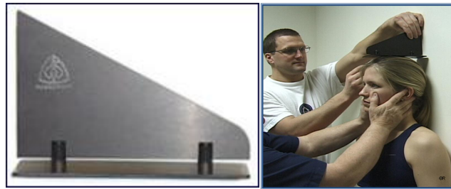
Gambar 4 Headboard