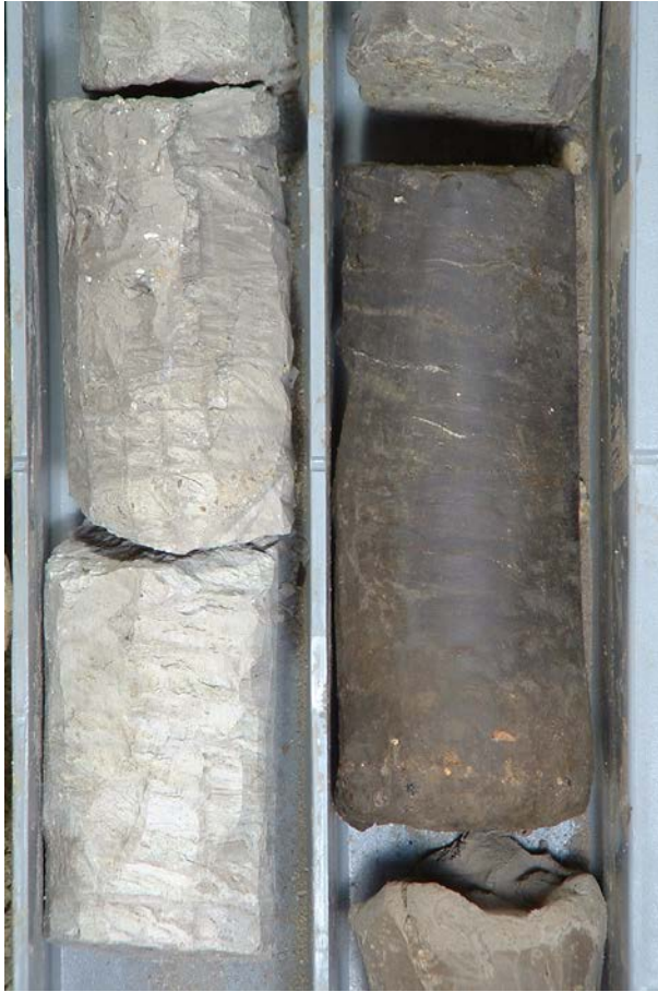
図2 藤田地区地下-13mから得られたAT火山灰層(左)と泥炭層A(右)

岡山平野からは4層準の泥炭層が認められる。図1の鈴木(2000)による地層区分を用いると、泥炭層 A: 洪積層最上部、泥炭層 B: 沖積層下部部層最上部、泥炭層 C: 図1には示されていないが出崎海岸で見出された縄文時代の潟の地層(鈴木・行基, 1999; 佐藤ほか, 2011)、泥炭層 D: 沖積層中部部層最上部である。