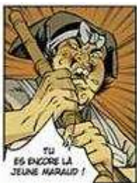
Figure 3 Vignette tirée du vol. 4 d' Okko de Hub ©

De même, certains auteurs publiés chez des éditeurs traditionnels reprennent-ils parfois quelques inspirations du manga dans une œuvre par ailleurs typiquement franco-belge dans sa construction. Nous pensons par exemple à Okko de Hub 57 dont l'image ci-dessous pourrait être directement tirée d'un manga japonais, avec ses traits qui renforcent l'exclamation du personnage