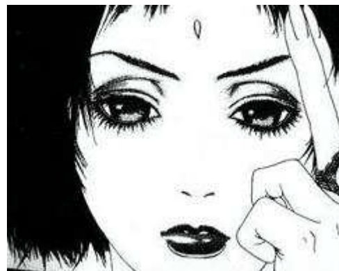
Figure 5 bis Tarot Café , Park Sang-sun ©