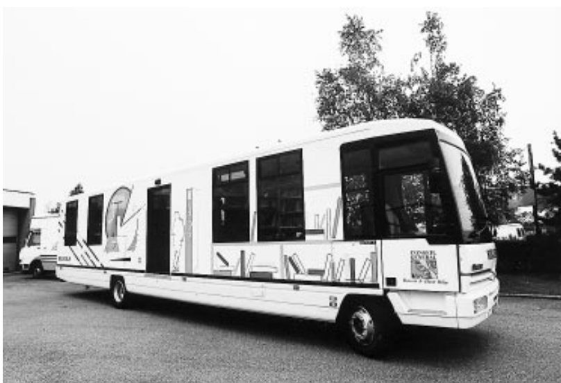
Le nouveau bibliobus de la bibliothèque départementale du Haut-Rhin