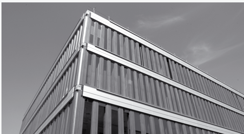
Le centre culturel Auguste-Dobel du CRE RATP.

Ces bibliothèques proposent des livres, des CD, des revues et des DVD. Elles sont ouvertes entre 11 h 30 et 14 h 30, une, deux ou trois fois par semaine. Elles sont situées aux abords du restaurant ou de la cafétéria et accueillent