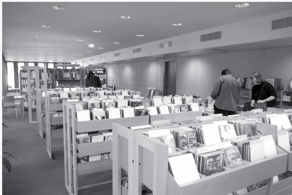
La médiathèque Louis-Aragon du CRE RATP.

En 2007, le logiciel des bibliothèques a été changé. Depuis 2001, les bibliothèques étaient équipées du logiciel Opsy 8.21. De conception ancienne, il a été remplacé en 2007 par Carthame, logiciel de nouvelle géné-