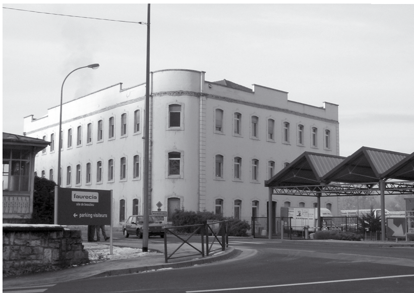
Bibliothèque du CIE Le Bélieu : Faurecia, site de Beaulieu Mandeure (Doubs).

prise. Aussi n'est-il pas rare de voir des conventions signées entre collectivités locales et comités d'entreprise pour permettre aux salariés de bénéficier des services de la médiathèque municipale ou d'agglomération. Cependant les relations restent souvent limitées au paiement par le comité d'entreprise de l'inscription du salarié à la médiathèque de la collectivité. Celle-ci peine à assurer sa mission.