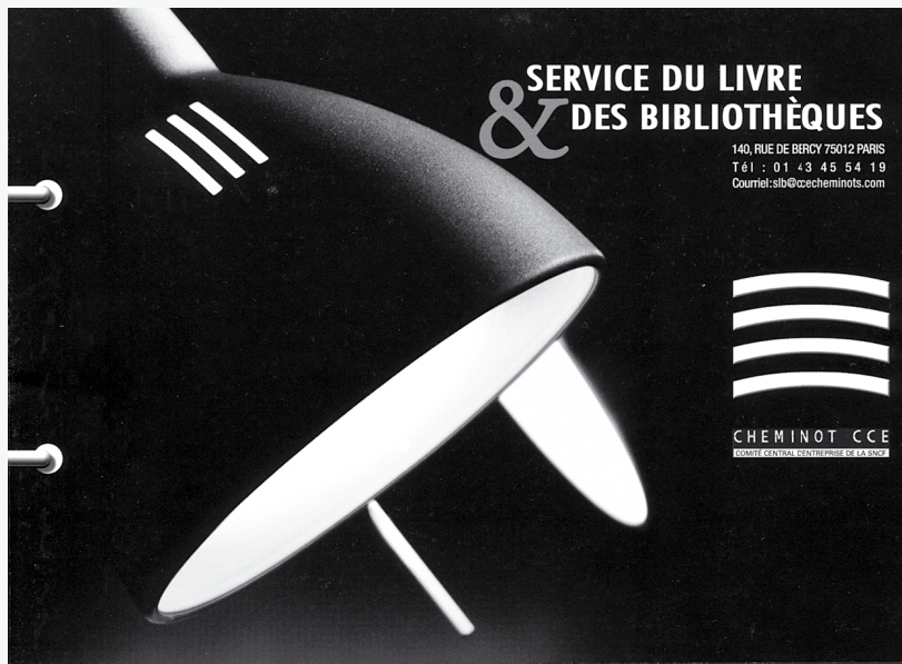
Plaquette de présentation du Service du livre et des bibliothèques. Conception réalisation : COMTOWN

Les bibliothécaires du SLB sélectionnent et expédient des ouvrages dans les 80 centres de vacances enfants de l'entreprise (7 500 livres/an). Les livres sont choisis en fonction de l'âge, du nombre d'enfants, de la spécialité du centre (musique, théâtre, sports...) et