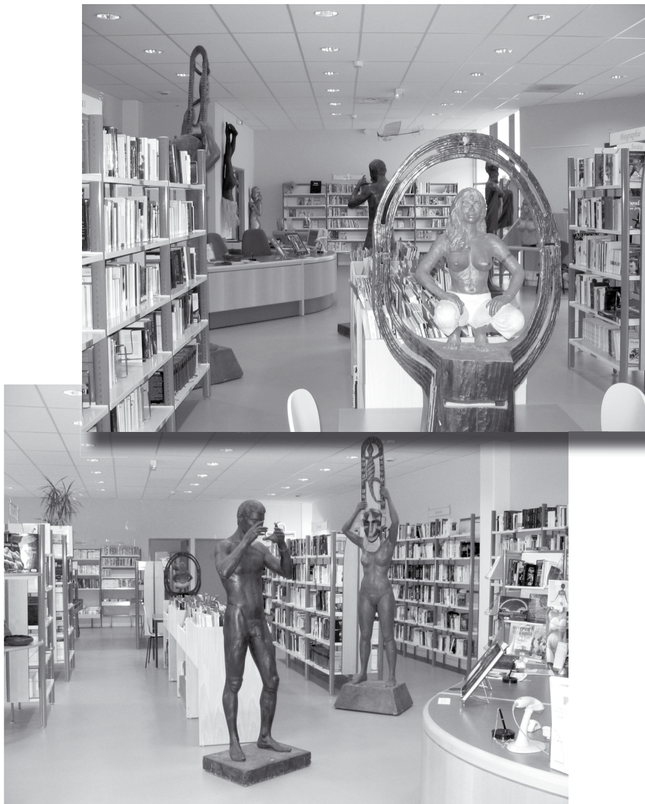
Médiathèque du CE d'Air France Industrie à Blagnac.

expression professionnelle et économique. La BCE devient alors un espace de premier ordre pour la conquête de nouveaux droits dans l'entreprise. De fait, la BCE possède une nature particulière au regard de la bibliothèque institutionnelle de lecture publique. Elle interpelle bientôt le milieu professionnel des bibliothécaires, qui la considèrent souvent comme un palliatif dans une organisation générale insuffisante du réseau de la lecture publique.