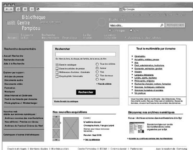
Figure 2 Maquette conceptuelle, livrée par le prestataire, reprenant les principales préconisations ergonomiques pour la page d'accueil du Portail

tifiaient le recours, mais nombreux sont ceux qui en ont déploré le manque de visibilité. En effet, dans la première version de l'interface, utilisée lors de la campagne de tests, il fallait cliquer sur l'intitulé « Catalogues » du menu de navigation latéral pour en dérouler le contenu et ainsi accéder à des fonctionnalités de recherche et de feuilletage thématique au sein des collections multimédias de la BPI (films, musique, documents d'autoformation, etc.). Cet aspect a été corrigé dès la seconde version du portail, mise en ligne début 2009 à l'occasion de son intégration au sein du nouveau site web.