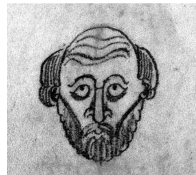
Bibliothèque municipale de Douai, Ms 250-2 Marchiennes. f. 166v Caricature marginale Le moine maussade.