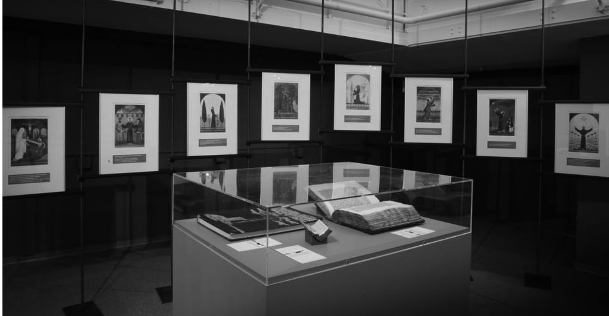
Exemple de scénographie. Exposition « Ens infinitum : à l'école de saint François d'Assise ». Au fond, la série de huit aquarelles tirées du Cantique des créatures , par Arnold Goffin et frère Ephrem de Kcynia (1923). Scénographie : Jean-Claude Goepp.

et le développement d'une pensée religieuse (la pensée franciscaine autour de saint François et de Duns Scot pour « Ens infinitum », les idées de la Réforme protestante pour les expositions consacrées à Sturm et à Calvin), ainsi que des fonds documentaires.