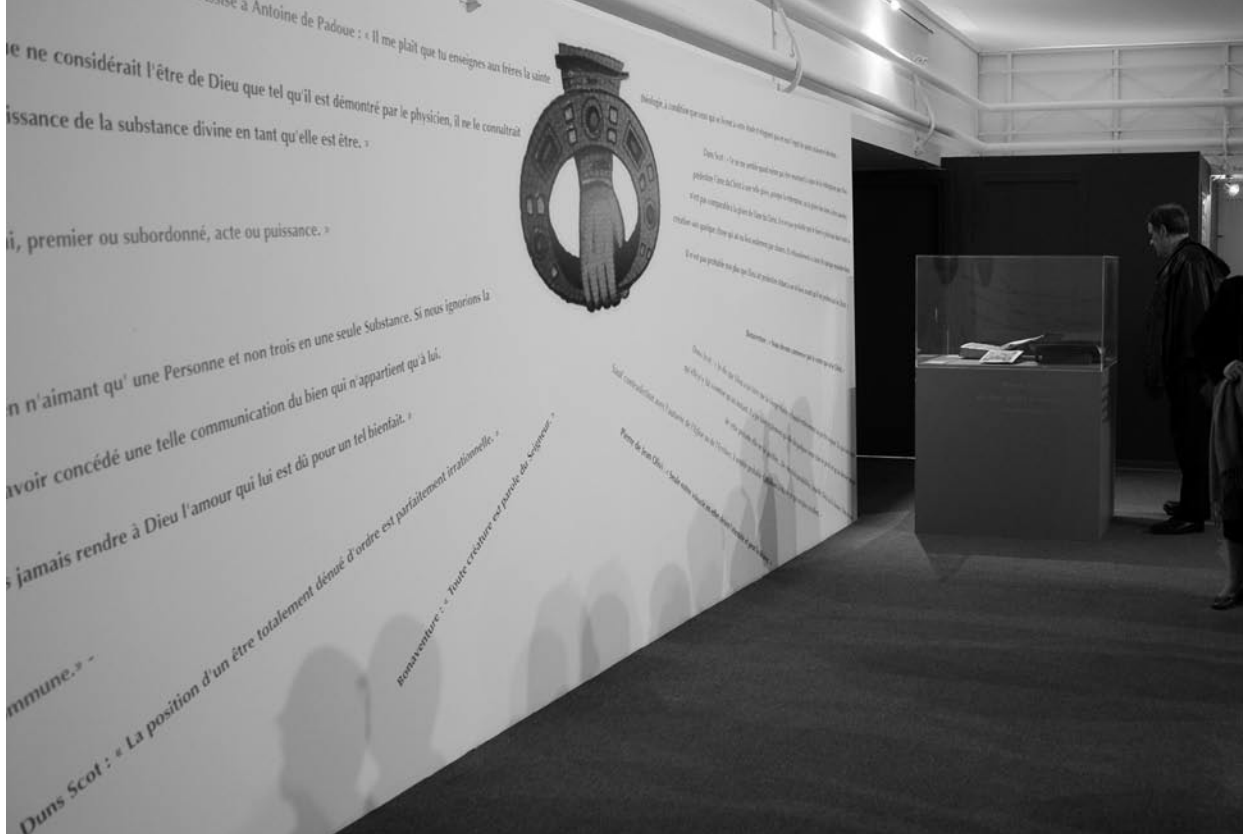
Le mur de citations. Exposition « Ens infinitum : à l'école de saint François d'Assise ». Conception : Jean-Claude Goepp et Sarah Lang.

ble la vie des franciscains en Alsace du xiv e au xx e siècle 13 .