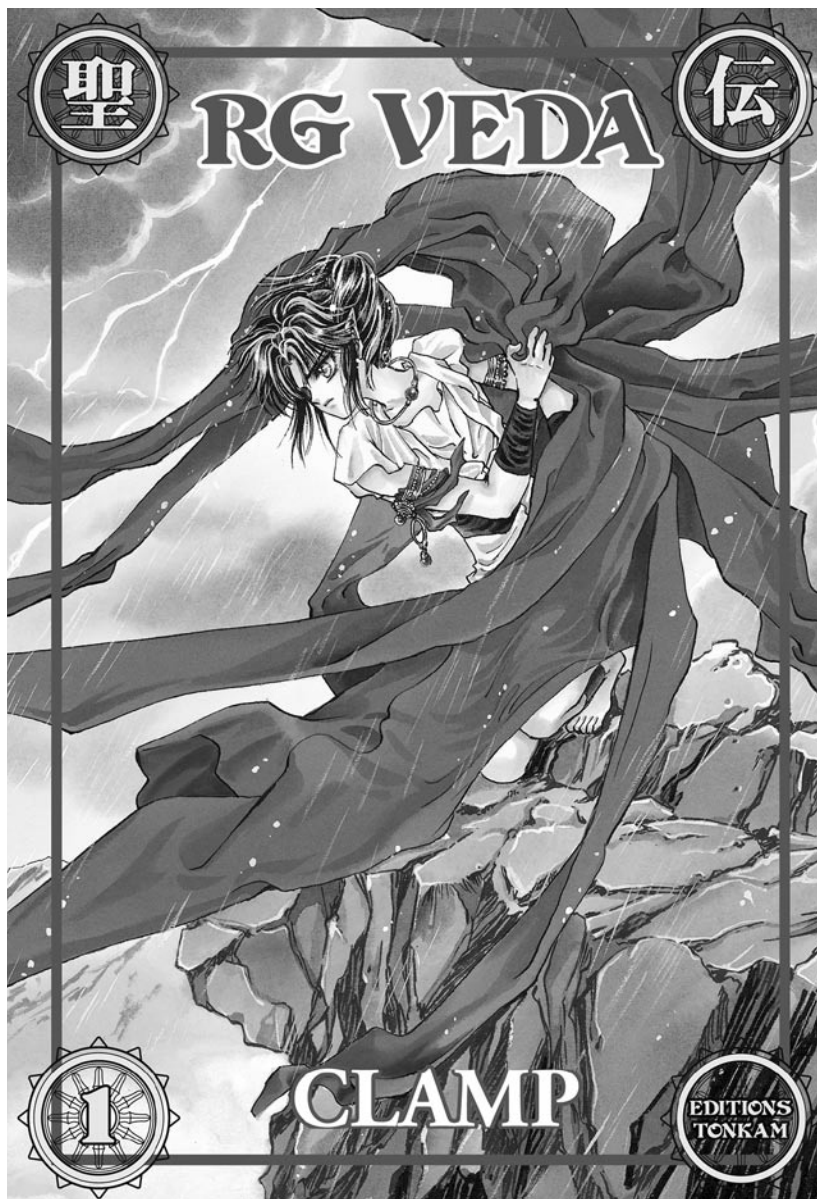
Couverture de la série RG Veda par le studio Clamp.

Au-delà de la simple question du fonds de manga et de sa légitimité au sein de nos collections, se pose aussi la question de l'action culturelle liée à la promotion de ce phénomène. Il nous semble que le manga pourrait exemplairement s'inscrire dans une politique culturelle travaillant autour de la notion de dialogue entre les cultures. Cultures occidentale et orientale, bien