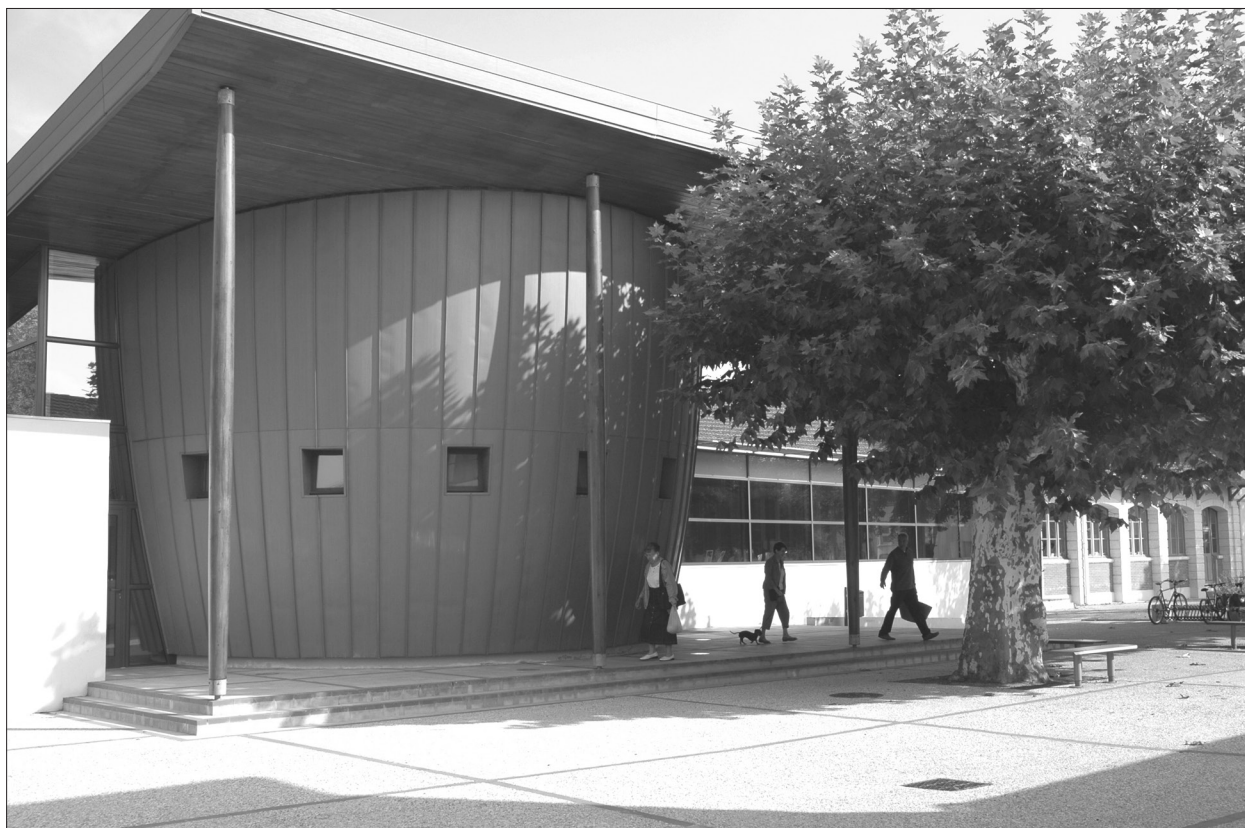
Médiathèque François Mitterrand à Morcenx.

Son implantation territoriale forte offre à ce réseau un socle de choix, propice à l'expérimentation. Pour répondre aux missions traditionnelles des bibliothèques, sa structure intercommunale lui permet de dépasser le seuil de fonctionnement nécessaire pour offrir des services efficaces et ambitieux. Toujours animée par la volonté de proposer des services nouveaux, de suivre les évolutions technologiques, la médiathèque du Pays Morcenais conserve toutefois une polyvalence adaptée à un fonctionnement de proximité indispensable aux petites structures.