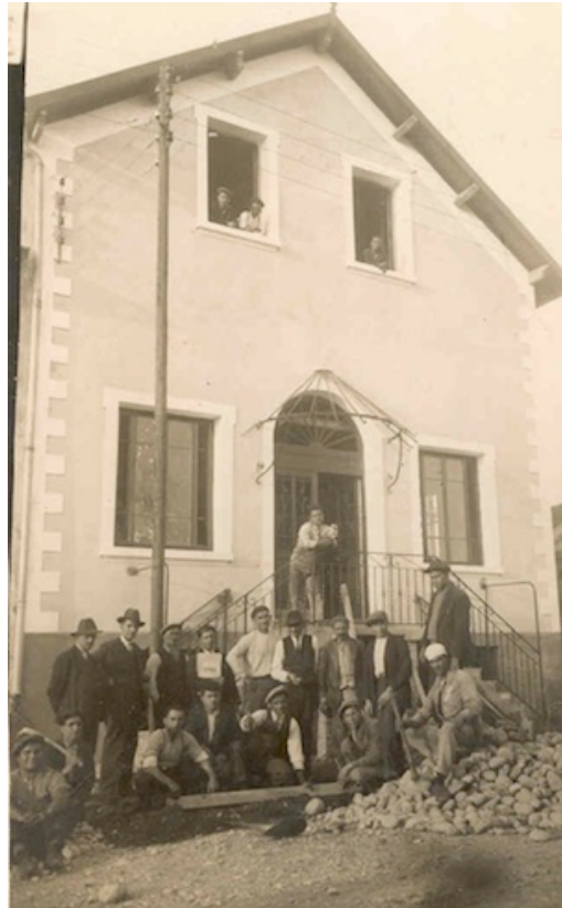
La Maison du Peuple, future MCAD

Marquée par plusieurs tentatives d'éradication, cette histoire et cette culture sont encore aujourd'hui un héritage douloureux : il y a donc un risque de « gel du deuil » pour cette minorité et sa descendance qui supprime la conscience de cette privation. D'après une