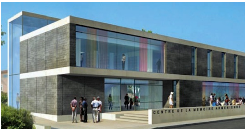
Projet National du CNMA