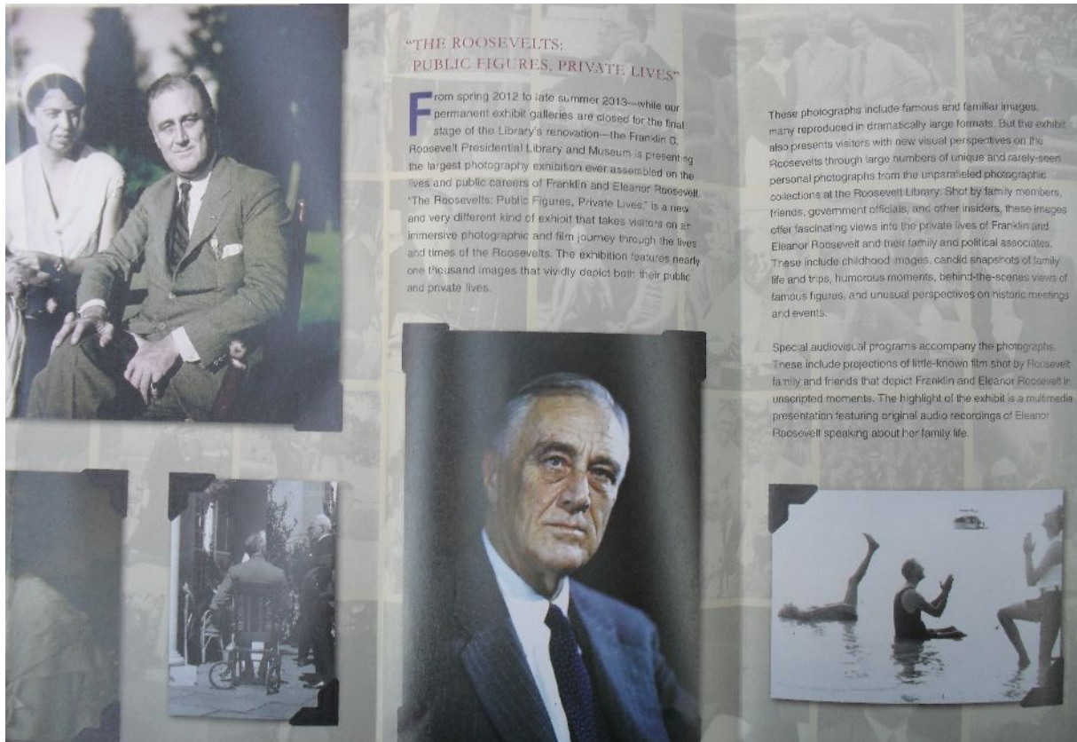
Brochure de la bibliothèque Roosevelt, Hyde Park, New York (photographie personnelle)

Plus sobre que pour l'exemple de la bibliothèque Kennedy, le choix des photographies que l'on voit ici fait tout de même sens : le choix est de mettre en avant l'intimité de Roosevelt, ainsi que sa vie de famille,