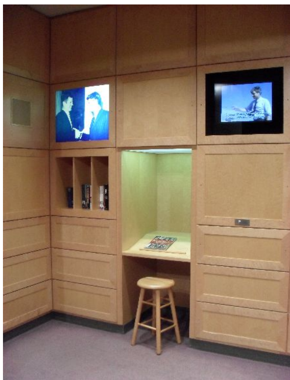
Espace de lecture consacré à Robert Kennedy, à la bibliothèque J.F. Kennedy, Boston, Massachusetts.

En revanche, à titre de contre-exemple, on peut mentionner la bibliothèque Roosevelt, qui, comme nous l'avons noté plus haut, semble la mieux dotée en livres de tout le réseau. Sa collection atteint 44 000 ouvrages, provenant pour une bonne part de Roosevelt lui-même : sa bibliothèque personnelle était particulièrement fournie, et comprenait notamment une grosse collection de pamphlets, d'ouvrages militaires ou de classiques de la littérature 50 , accessibles aujourd'hui dans sa bibliothèque au même titre que les documents d'archives.