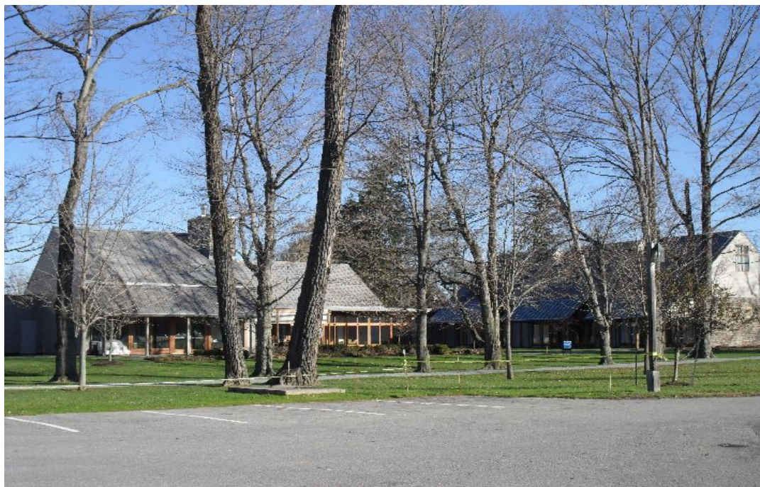
La bibliothèque Roosevelt à Hyde Park, New York (photographie personnelle).

Installée dans l'ancien domaine personnel de Roosevelt, la bibliothèque fait partie d'un ensemble plus large, incluant une zone préservée, et d'autres bâtiments historiques, comprenant la demeure de Roosevelt – séparée de la bibliothèque – et le « Vanderbilt Mansion », manoir du XVIII e siècle, lui-même entouré d'une zone naturelle protégée et dépendante du domaine des Parcs nationaux américains.