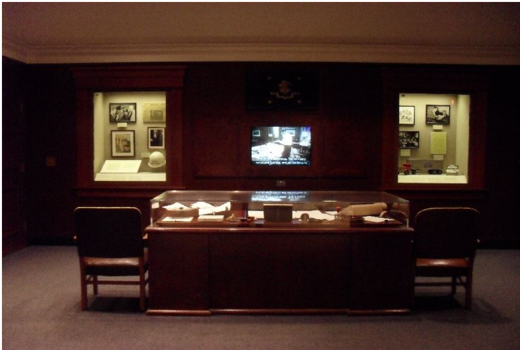
Reconstitution du bureau de l' « attorney general », occupé à l'époque par Robert Kennedy. Bibliothèque Kennedy, Boston, Massachusetts