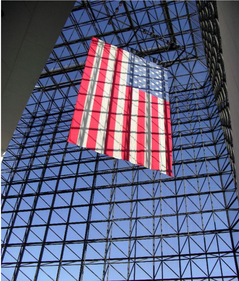
Vue intérieure de la bibliothèque Kennedy, Boston, Massachusetts (photographie personnelle).

Cette immense baie vitrée abritant la « star-splanged banner » et donnant sur la baie de Boston est un bon exemple de la volonté, autant architecturale que symbolique, de placer les bibliothèques présidentielles dans la lignée des grands bâtiments commémoratifs des héros de la nation, afin d'en faire des démonstrations spectaculaires d'appartenance commune et de patriotisme.