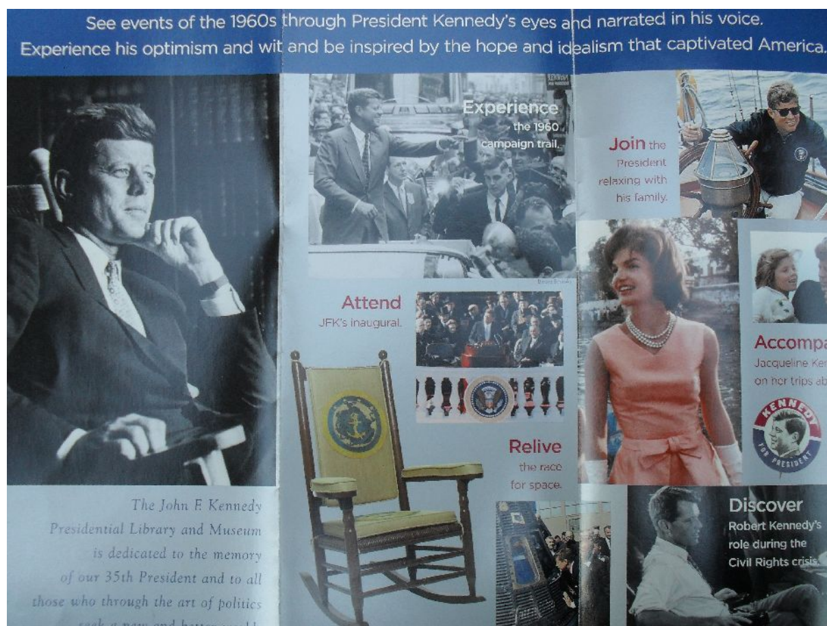
Brochure de la bibliothèque Kennedy, Boston, Massachusetts (photographie personnelle).

Comme nous l'avons noté dans la deuxième partie de cette étude, les bibliothèques présidentielles insistent largement sur une approche « participative » de l'histoire, en encourageant les visiteurs à devenir eux-mêmes acteurs de l'époque revisitée. On s'en rend bien compte ici avec l'utilisation de verbes d'action, « rejoignez », « revivez », « découvrez », etc.