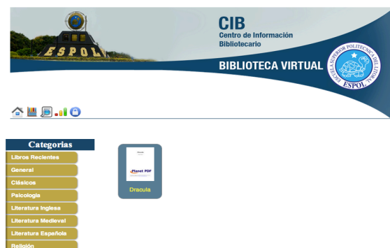
Figura 6. Módulo usuario – vista general