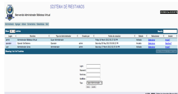
Figura 5. Módulo administrador – vista general