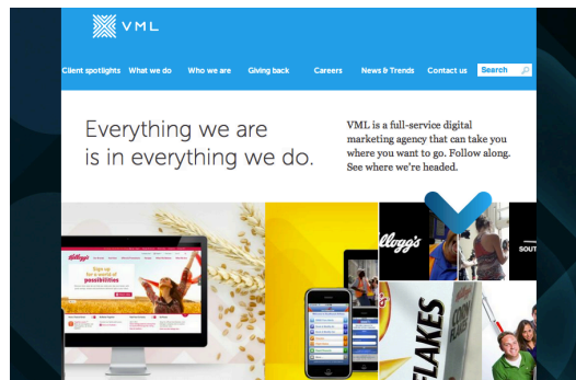
Figura 3. Responsive web design pantalla mediana