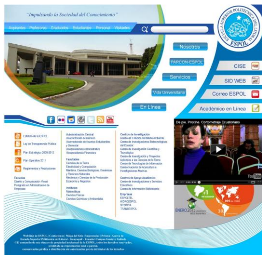
Figura 2. Diseño de página web