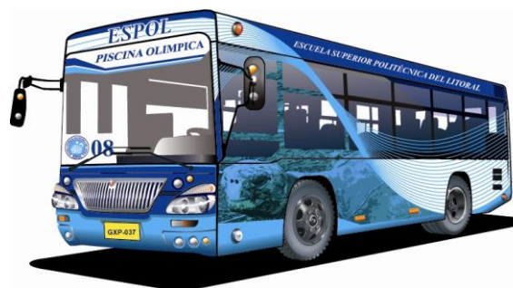
Figura 1. Diseño de unidades de transporte (bus)

El Manual de Marca debe de ser impreso, es la guía para todas las facultades y unidades académicas o administrativas que requieran de un discurso visual, consta de los lineamientos y parámetros necesarios para llevar un adecuado manejo del discurso visual institucional. Además de ser la herramienta obligatoria definitiva de ayuda y consulta del diseñador ante cualquier duda o al momento de realizar alguna pieza gráfica necesaria a ser implementada para la institución, o para ser consultado ante cualquier tipo de necesidad de diseño concerniente a la institución.