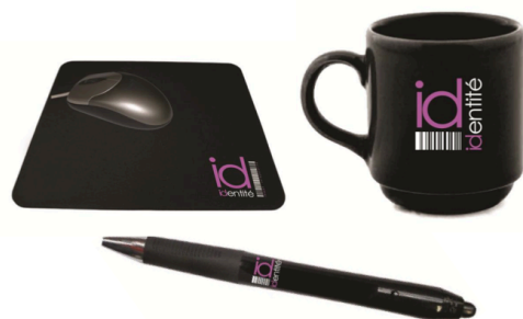
Figura 4. Merchandising (artículos varios)