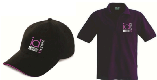
Figura 3. Merchandising (gorras y camisetas)

Teniendo claro este concepto sabemos la importancia del Merchandising para nuestro servicio, el cual se ha diseñado con mucho cuidado el concepto de nuestra Empresa en cómo será proyectada visualmente nuestra Marca. "Una marca exitosa empieza por un concepto exitoso en el punto de venta".