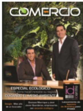
Figura 5. Revista

Medios Impresos (Revistas - Periódico): Se publicarán anuncios en “Comercio” una revista de la Cámara de la Pequeña Industria que está dirigida a las pequeñas y medianas empresas; publicidad que cuenta con gran reconocimiento en el medio. A la vez estaríamos afiliados a dicha entidad con el fin de estar involucrados de una manera eficiente, teniendo conocimiento sobre las nuevas empresas que se crean, y a la vez obtendríamos información sobre el movimiento de los negocios vigentes en el mercado.