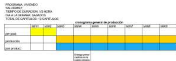
Figura 5. Cronograma General del Programa

La primera temporada, de 12 capítulos deberá elaborarse en un lapso de 2.5 meses, contando la Preproducción, la Producción y la Postproducción del producto.