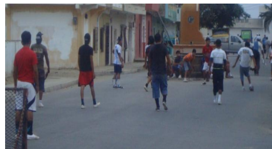
Foto 1. Grupo de jóvenes jugando futbol

El análisis reflejó que el 33% de los salinenses dedica tu tiempo libre al deporte, entre los que sobresalen esta el futbol y el voleibol.