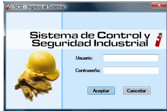
Figura 1. Pantalla Inicial de la Aplicación Informática

El objetivo de la aplicación informática es complementar y facilitar la administración y el control del Sistema.