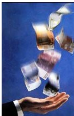
Figura 1.2 Programa de Cultura Tributaria

El Ministerio de Educación, declaró el 28 de Abril de cada año, el Día Nacional de la Cultura Tributaria. Sin tributación no hay derecho; sin impuestos no existe libertad de mercados ni de propiedad privada, habría esclavitud.