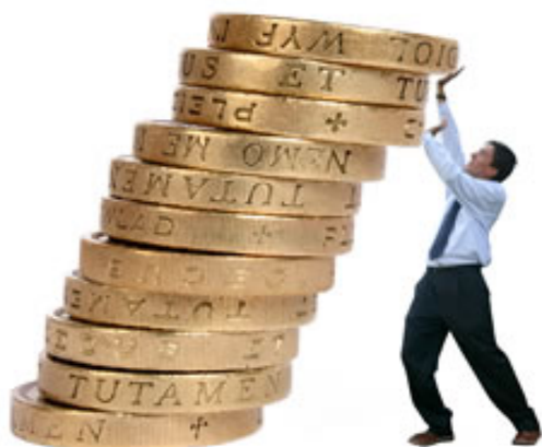
Figura 1.1 Día de la Cultura Tributaria

El Servicio de Rentas Internas implemento un proyecto para fomentar el pago de impuestos denominado Día de la Cultura Tributaria que se llevo acabo el 27 de Abril del 2008.