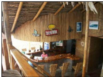
Foto 3. Bar-restaurant del lugar