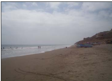
Foto 2. Playa de Piedra Larga