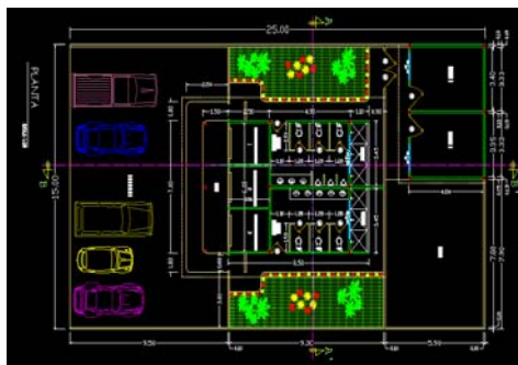
Foto 4. Plano del centro de equipamiento

El centro de equipamiento Piedra Larga tendrá un horario de atención al público de 9h00 a 17h00. A pesar de que esta propuesta será manejada directamente por la Municipalidad de Manta, creemos conveniente mencionar el personal necesario para tener operativo el equipamiento propuesto, por lo que se contará con el siguiente personal: un administrador, 2 cuidadores de baño y limpieza, 3 salvavidas, y un guardián-cobrador. Este proyecto será gestionado por el Municipio de Manta y ejecutado por un contratista, y contará con los estudiantes de turismo como organismo de apoyo. Para su construcción se invertirá en la obra civil, en los equipos necesarios para el adecuado funcionamiento, y en los gastos que requiera su constitución legal. En cuanto a la evaluación de impactos, se pretende causar un leve impacto al ambiente, procurando no afectar la salud de la población porque se utilizarán materiales propios de la zona que irán acorde al medio. El proyecto del centro de equipamiento Piedra Larga busca como fin el bienestar social del sector, ya que se mejorará el aspecto de la playa, atraerá al turismo y dará empleo a sus habitantes, mejorando así su calidad de vida.