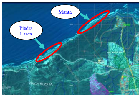
Foto 1. Ubicación de Piedra Larga

que existen camotillos, rayaletas, caballas, pinchaguas, gringos, oyocos, mortajas, bocabierta, langosta y ostras. La carretera que conduce a Piedra Larga es conocida como la Ruta del Sol, siendo el tramo Manta – San Mateo la que lleva al sector. La vía se encuentra asfaltada y con la respectiva señalética, la calle principal del lugar, es lastrada. Para llegar a Piedra Larga se debe tomar una camioneta en el mercado de Manta, la cual deja al visitante en la carretera principal. Dichos carros salen cada 15 minutos y el pasaje tiene un valor de $0.30. Con respecto a la infraestructura, la población solo cuenta con energía eléctrica la cual es proporcionada por EMELMANABI. No hay una red de agua potable, los habitantes del lugar compran agua a los tanqueros, tampoco cuentan con alcantarillado ni servicio de telefonía fija pero sí existe cobertura celular.