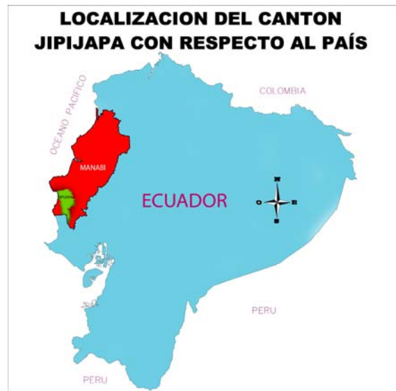
Figura 2. Mapa del Ecuador con la ubicación de Jipijapa.

01 grados 47 minutos de latitud sur, y entre los 80 grados 25 minutos y 80 grados 52 minutos de longitud oeste. El cantón cuenta con una extensión de 1.420 Km 2 .