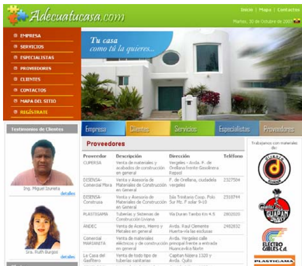
Figura 7. Página de proveedores

En esta página podrá visualizar los datos del proveedor (su nombre, descripción de los productos que ofrece, su dirección y teléfono) a fin de que los usuarios dispongan de información útil como un catálogo de empresas que ofrecen materiales de