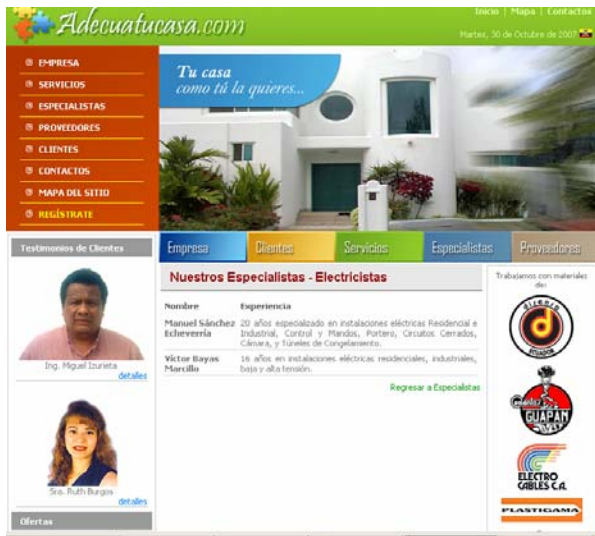
Figura 6. Página de especialistas -electricistas

la construcción, aquí se divide en especialistas profesionales (Ingenieros, arquitectos, decoradores, etc.) y especialistas de oficio (Electricistas, carpinteros, cerrajeros, albañiles, yeseros, etc.) en cada una de estas ramas se puede dar clic y obtener información importante de la experiencia de cada uno de los especialistas aquí registrados (ver figura 6), esta página se alimenta o actualiza de la tabla de especialistas de la base de datos implementada, el ingreso de los especialistas se lo realiza por medio del panel de control otorgado por el proveedor del hosting afectando directamente a la base, esto es realizado únicamente por el administrador del portal.