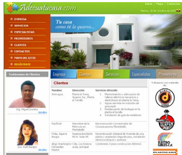
Figura 8. Página de clientes

En esta pantalla se muestra todos los clientes a quienes se les ha realizado algún servicio, consta el nombre del cliente particular o empresa, su dirección y el servicio realizado.