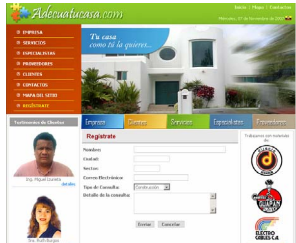
Figura 9. Página de registro de consultas

Al dar clic en "Regístrate" se mostrará la pantalla indicada arriba, el usuario que desee un servicio en particular o solicite mayor información del mismo ingresará sus datos (su nombre, ciudad y sector donde vive, su correo electrónico), el tipo de consulta que requiere y un detalle del servicio en que esté interesado