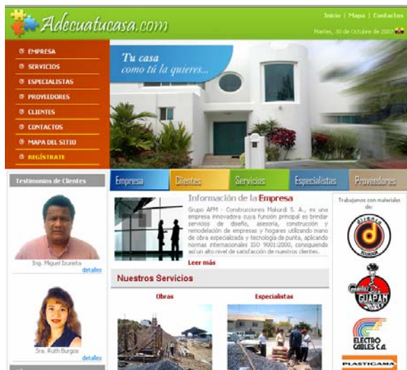
Figura 3. Página principal “adecuatucasa.com”

Consta en su cabecera de un logo similar a un rompecabezas con el título “Adecuatucasa.com” que simboliza la reconstrucción de todo o parte de una vivienda o, el diseño de la misma, su promesa básica “Tu casa, como tu la quieres” hace referencia a los servicios que se ofrecen adaptándose a los gustos y necesidades de los clientes, link anaranjados a las páginas del portal y la imagen de una vivienda, en el detalle se muestran 3 columnas: en la primera se muestra datos de testimonios que han solicitado servicios a la empresa, esto incluye imágenes de las