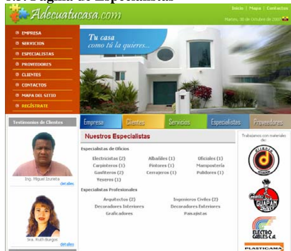
Figura 5. Página de especialistas

En esta página se puede apreciar las especialidades relacionadas a las distintas ramas complementarias de