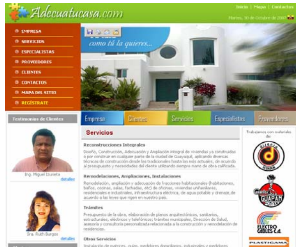
Figura 4. Página de servicios

En esta pantalla se muestra el detalle de los servicios ofrecidos como: Reconstrucciones integrales, remodelaciones, ampliaciones, instalaciones, trámites y otros servicios en general, cabe destacar que se mantiene el esquema de la pantalla principal solo cambia la columna central.