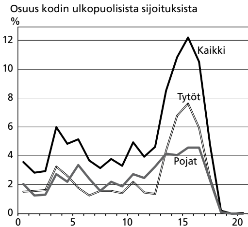
Kuvio 2. Osuus kaikista kodin ulkopuolisista sijoituksista (n=1 900) ensimmäisen sijoitusiän mukaan sukupuolet yhdessä ja erikseen

kolmannesta (66,3 %) kodin ulkopuolelle sijoitetuista oli seuranta-aikana sijoitettuna yhteensä kauemmin kuin vuoden, reilu kolmasosa kaikista sijoitetuista kuitenkin yli 5 vuotta (35,2 %). Laitoshoidossa oli ollut jossain vaiheessa elämänsä yli puolet sijoitetuista, vajaa 40 prosenttia perhehoidossa ja vajaa kolmannes ammatillisessa perhehoidossa (taulukko 2).