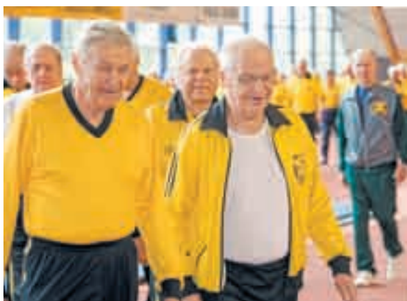
Aarnen tallissa kuntoillaan tosissaan, mutta ei otsa rypyssä.