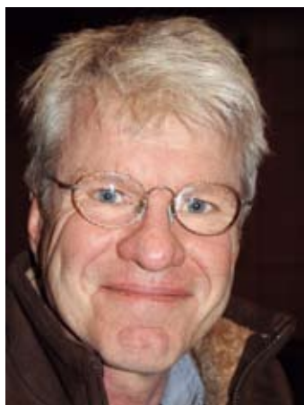
Psykoosien genetiikkaa tutkiva Michael Owen Cardiffin yliopistosta Walesista puhui kesällä Suomessa pidetyssä Human Genome -kokouksessa.

Geenitutkimus hälventää psykoosien jakoa skitsofreniaan ja kaksisuuntaiseen mielialahäiriöön. Kummankin sairausryhmän taustalla on todennäköisesti useita alttiusgeenejä, joista osa saattaa olla samoja.