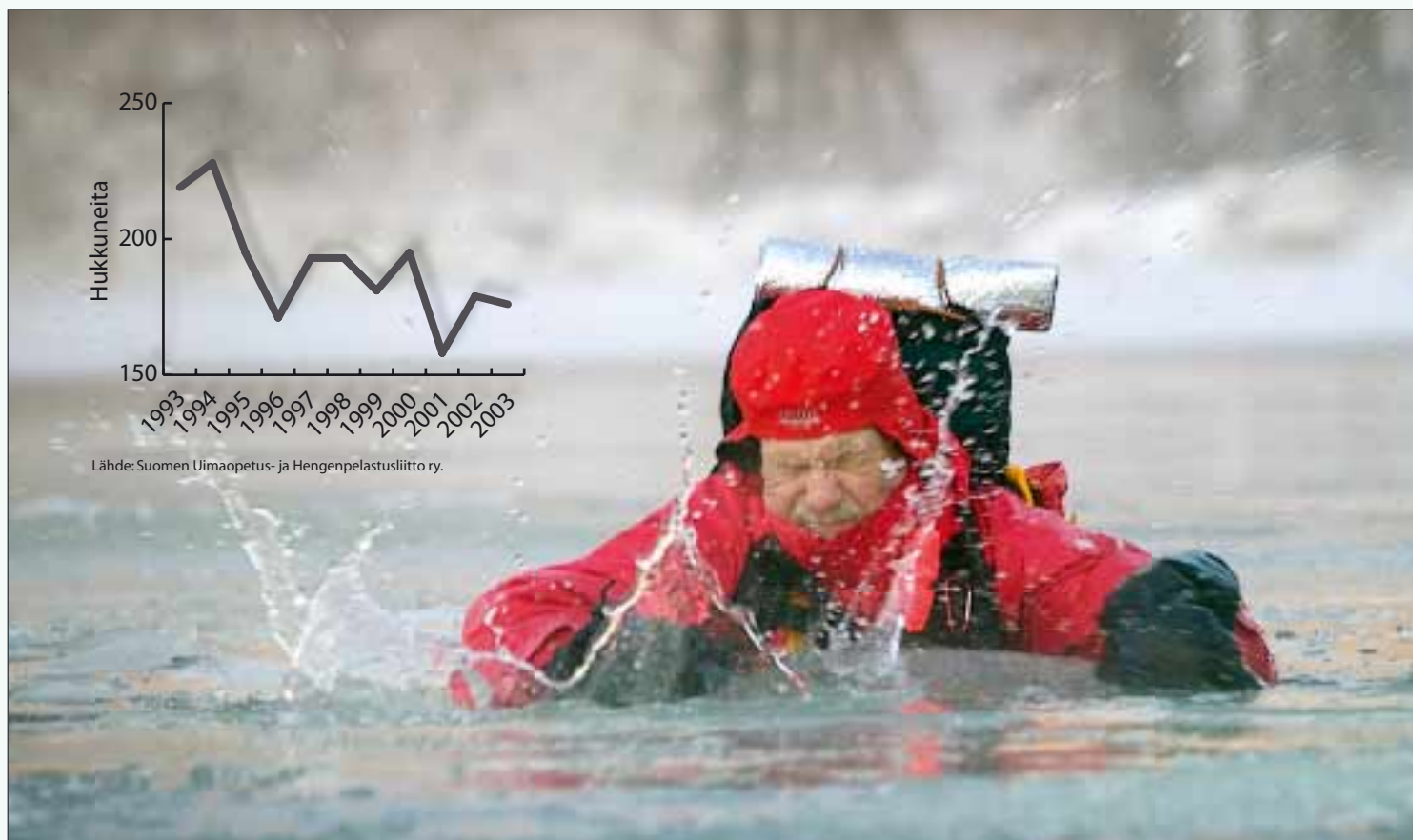
Kuva: Pekka Holmström

Lähde: Suomen Uimaopetus- ja Hengenpelastusliitto ry.