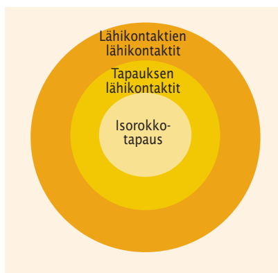
Kuvio 2. Isorokkorokotusten ja oireiden seurannan kohderyhmät epidemian leviämisen torjunnassa.

Väestön ehkäisevää rokotamista tai kohdentamattomia joukkorokotuksia vastaan puhuvat lukuisat seikat (4,5). Laajamittaisissa rokotuksissa vakavien haittavaikutusten määrä tulisi olemaan merkittävä. Väestötason kampanjassa rokotettaisiin suurimmaksi osaksi henkilöitä, joiden tautiriski on pieni, ja todennäköisesti paljon sellaisia henki-