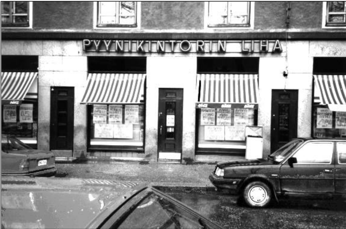
Kauppiaan kanssa kannattaa aina neuvotella kotiinkuljetuksesta, Osalla ruokakaupoista kotiinkuljetus voi olla jopa ilmainen. (Kuva: Sonja Heikkinen).

toksilla käydään yhdessä vanhuksen kanssa, silloin kun tarve vaatii.