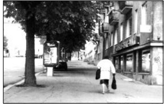
Kuljetuspalvelujen tarve kasvaa vanhusten määrän lisääntyessä.