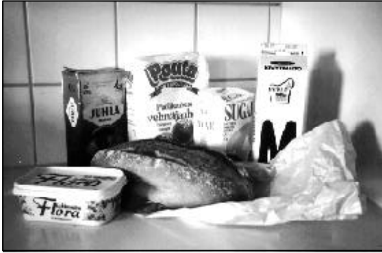
Voisiko ateriapalvelu tuoda myös nämä?