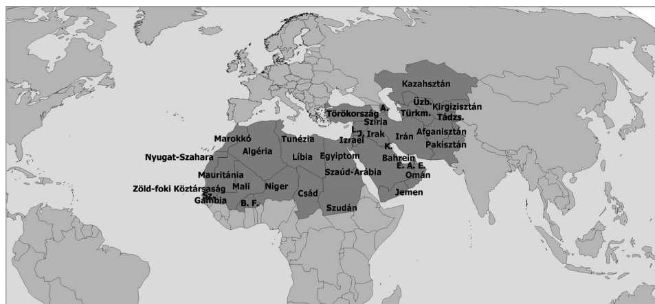
97. ábra: Az Iszlám Világ kultúrrégiójához tartozó országok