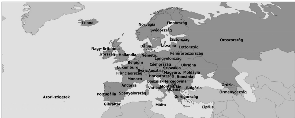
92. ábra: Európa kultúrrégiójához tartozó országok

A helyzetet a különböző politikai alapon lehatárolt európai nemzetközi szervezetek tagsági köre még tovább bonyolítja. Az Európa Tanácsnak (amely nem tévesztendő össze az Európai Unió csúcsszervével, az Európai Tanáccsal) Kazahsztán kivételével valamennyi ország tagja. Ezzel szemben az Európai Unió, amely maga is egy mozgó taglétszámú, fokozatosan bővülő szervezet, jóval kevesebb – 2012-ig 27 – tagországgal rendelkezett. Megemlítendő, hogy az Európai Uniónak vannak tengerentúli területei is. 1973-ban Dánia tagságával a külterülete Grönland is tagjává vált az Európai Gazdasági Közösségnek, amelyből 1983-ban kilépett. Még ma is számos kisebb-nagyobb tengerentúli terület az Európai Unió szerves részét képezi (pl. Francia Guyana). Nyilvánvalóan ez nem jelent(het) automatikusan európaiságukat. Jelen könyv Európához sorolja Oroszország Urálon inneni részét, Grúziát, Örményországot és Ciprust is, ugyanakkor nem része Kazahsztán Azerbajdzsán és Törökország. Ez alapján Európa szinte kerekén 10 millió km 2 -es területével valamivel több mint 700 millióan élnek. (92. ábra)