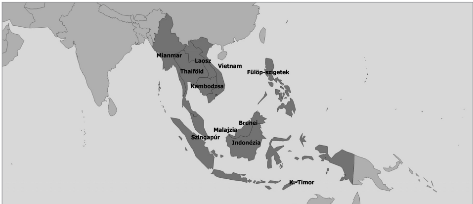
98. ábra: Délkelet-Ázsia kultúrrégiójához tartozó országok

Délkelet-Ázsia (más néven Hátsó-India vagy Indokína) területileg könnyen lehatárolható , hiszen részben szigetekre terjed ki, az Indokínai-félszigetet pedig szintén természetes határokat képező magas hegyek választják el a szomszédos térségektől. Délkelet-Ázsia viszonylag kis területű és népességű kultúrrégió. Területe (4,5 millió km 2 ) és lakónak száma (valamivel több mint 600 millió fő), többé-kevésbé Kína értékének felét teszi ki, így átlagos népsűrűsége (130 fő/km 2 ) is természetesen többé-kevésbé megegyezik Kínáéval. (98. ábra) Nagyvonalakban két nagyobb egységre osztható: az Indokínai-félszigetre és az Indonéz-szigetvilágra (egyes felosztások ez utóbbiból a Fülöp-szigeteket már egy harmadik külön egységként kezelik).