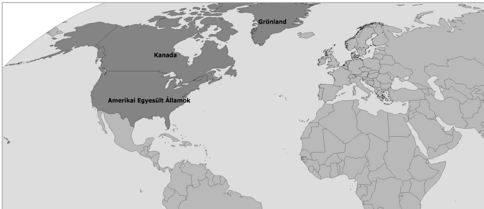
93. ábra: Észak-Amerika kultúrrégiójához tartozó országok

Ha Észak-Amerikához Grönlandot, Kanadát és az USA-t vesszük, akkor 22 millió km 2 -es területe nagyjából épp megegyezik Latin-Amerikáéval. (93. ábra) Itt található a Föld 2. (Kanada) és 4. legnagyobb területű országa (USA), mindkettő nagyjából Európához hasonló méretű. Észak-Amerika 350 millió fős népessége – bár továbbra is nagy bevándorlási nyomás nehezedik rá – azonban jócskán elmarad a XX. század közepén elképesztő demográfiai robbanást megélt szomszédos latin-amerikai kultúrrégiótól. A nagy területből és az ehhez képest viszonylag kisebb népességszámból következik Észak-Amerika alacsony átlagos népsűrűsége (16 fő/km 2 ), amely területileg egyébként rendkívül szélsőségesen oszlik meg, pl. kb. 50–50 millióan élnek az észak-atlanti part Bostontól New Yorkon át Washingtonig húzódó megalopoliszában (BosWash) és a Nagy-Tavak Chicagótól Pittsburgig elterülő megalopoliszában (ChiPitts) és további 38 millióan Kalifornia állam San Franciscótól Los Angelesen keresztül San Diegóig elnyúló megalopoliszában (SanSan).