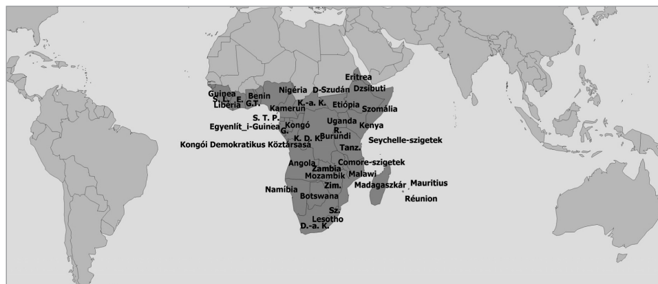
100. ábra: Trópusi-Afrika kultúrrégiójához tartozó országok

A fenti lehatárolás alapján Trópusi-Afrika mintegy 17 millió km 2 -es kiterjedésű terület, gyorsan növekvő lakossága 2012-ben közel 760 millió fő, mindkét jelzőszám tekintetében nagyjából 11 százalékos világrészesedéssel bír. (100. ábra) Ez egyúttal azt is jelenti, hogy átlagos népsűrűsége lényegében nem tér el a világtól. Trópusi-Afrika országait általában négy alrégióhoz szokás sorolni: Kelet-Afrika (amelytől egyes beosztásokban külön egységként kezelik Északkelet-Afrikát), Dél-Afrika, Egyenlítői-Afrika (más néven Közép-Afrika), valamint a Felső-Guineai-partvidék országait felölelő Nyugat-Afrika.