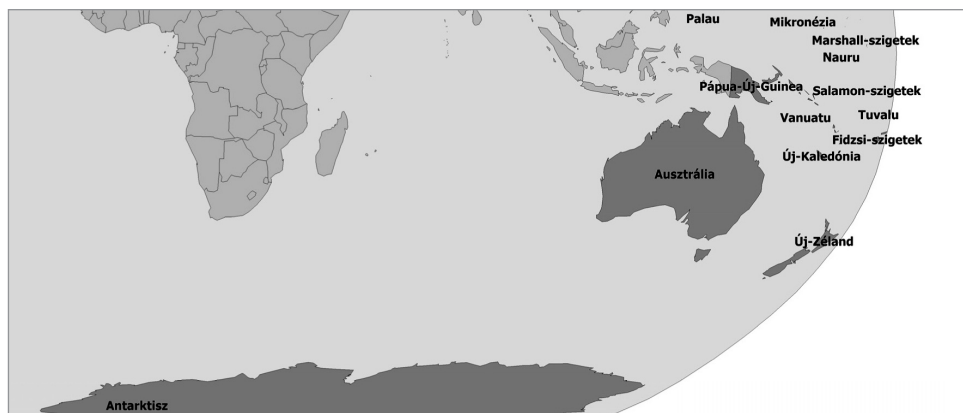
95. ábra: Ausztrália kultúrrégiójához tartozó országok