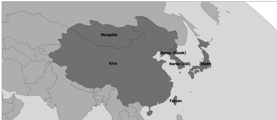
94. ábra: Kelet-Ázsia kultúrrégiójához tartozó országok

előzni. Kelet-Ázsia a világ sűrűbben lakott régiói közé tartozik (átlagosan 130 fő/km 2 ), a benépesültség azonban elsődlegesen a tengerparti zónára koncentrálódik, a periferikus fekvésű nyugati és az északi etnorégiók (Tibet, Hszincsiang Ujgur, Belső-Mongólia) még mindig alig benépesültek.