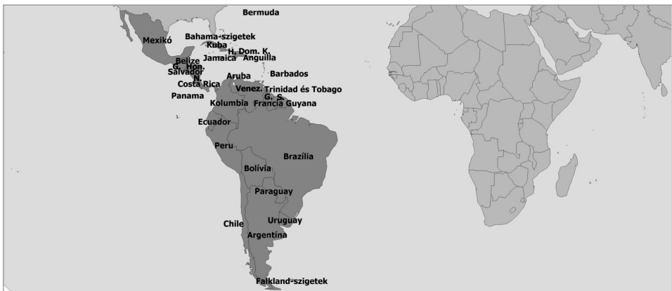
96. ábra: Latin-Amerika kultúrrégiójához tartozó országok

A latin-amerikai kultúrrégiót Észak-Amerikától leginkább a Mexikó és az USA közötti jelenlegi államhatár választja el. Eszerint Latin-Amerika Észak-Amerikával nagyjából megegyezően valamivel több mint 20 millió km 2 -es kiterjedésű, lakóinak száma azonban 2012-ben már meghaladta a 600 millió főt, ami jócskán meghaladja északi szomszédja értékét. (96. ábra) Az óriási kiterjedésű terület két nagyobb egységre osztható: Dél- és Közép-Amerikára. Közép-Amerika (Middle America) maga is tovább bontható három alegységre: a Karib-szigetekre, Mexikóra és a Közép-amerikai Földhíd térségére. Természetföldrajzi értelemben Észak-Mexikó nem különül el Észak-Amerikától, csak a Tehuantepec-földszorosostól délebbre fekvő területe a Yucatán-félszigettel tartozik a szűkebb értelemben használt Közép-Amerika fogalmához (Central America).